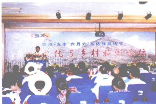
“布依文化与乡村旅游论坛”会场