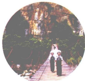
贞丰小花江铁索桥