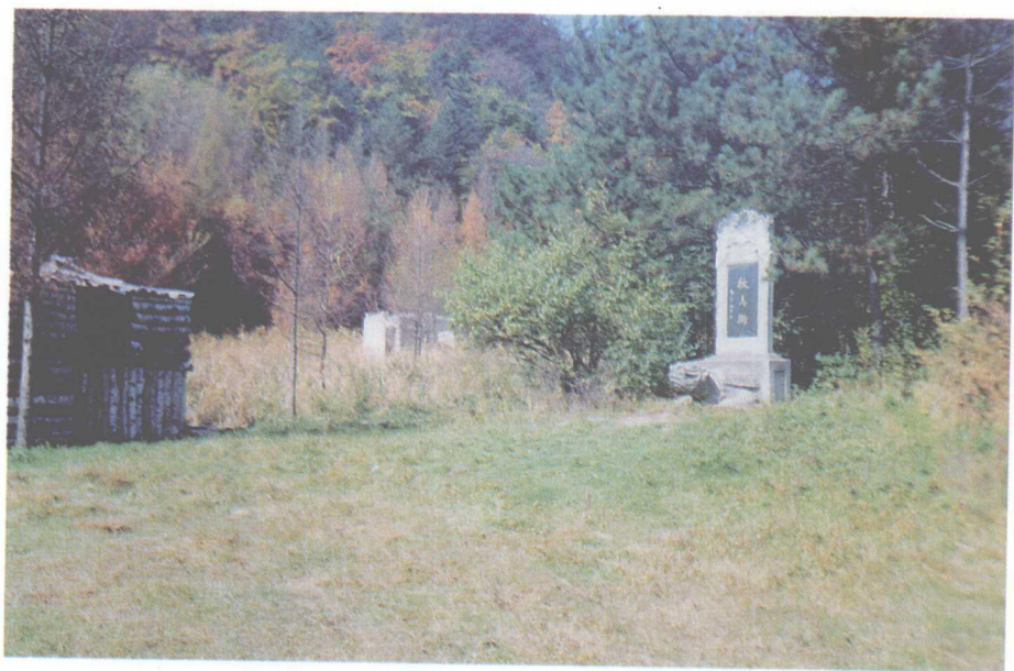
天水放马滩秦墓及木板地图出土地外景