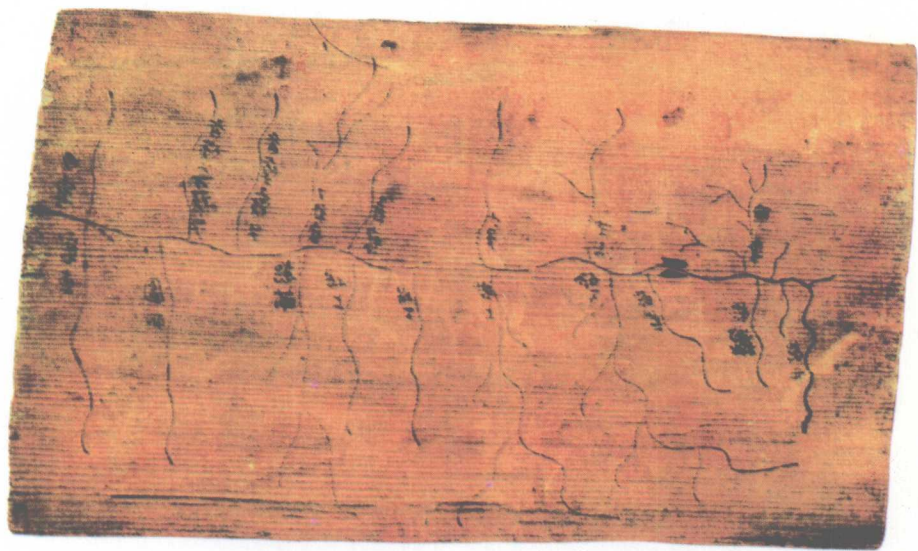
天水放马滩秦墓出土木板地图(战国)