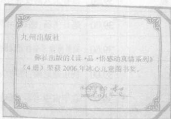
“读·品·悟”感动真情系列