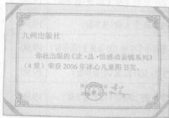
“读·品·悟”感动亲情系列

好书不但要畅销,更要经得起社会的检验。“读·品·悟”系列图书以为读者创造最大阅读价值为己任,每册书的每个环节都是匠心独运,倾注着编撰者的智慧和心血。曾经的努力,赢得了相应的声誉,本系列图书接连荣获冰心儿童图书奖3项大奖。