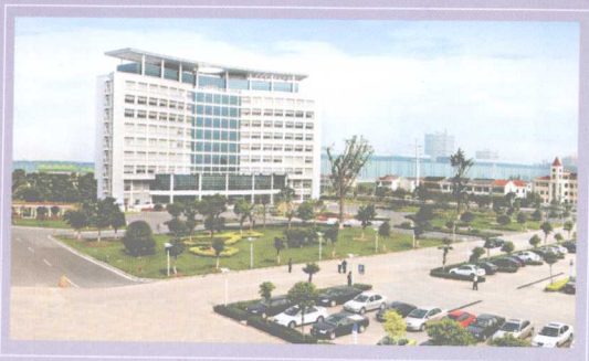
永钢集团总部办公楼