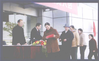
“文明家庭奖”颁奖现场