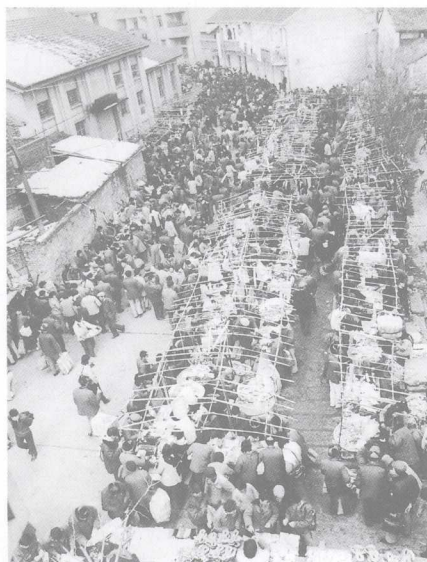
第一代义乌小商品市场 ——湖清门市场