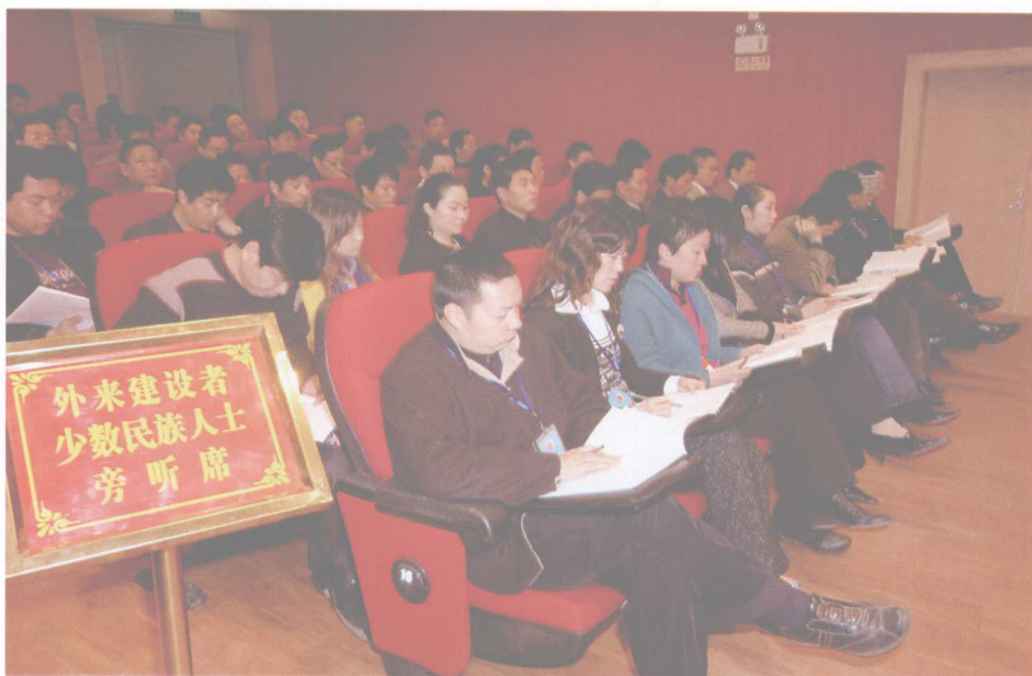
外来建设者和少数民族人士代表旁听人代会