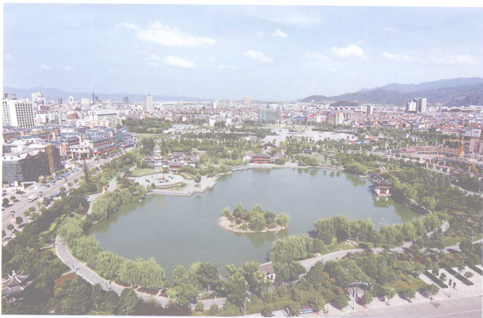
义乌地域文化的象征——绣湖和大安寺塔