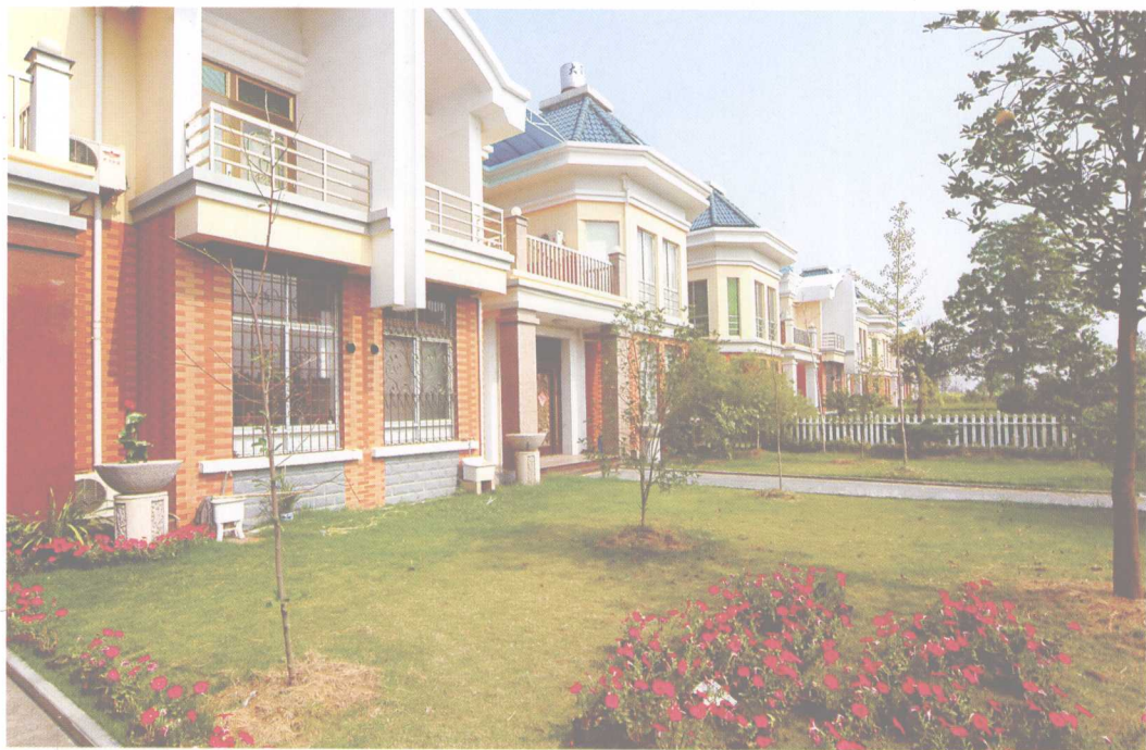
新农村新风貌——义乌市佛堂镇楼村民居