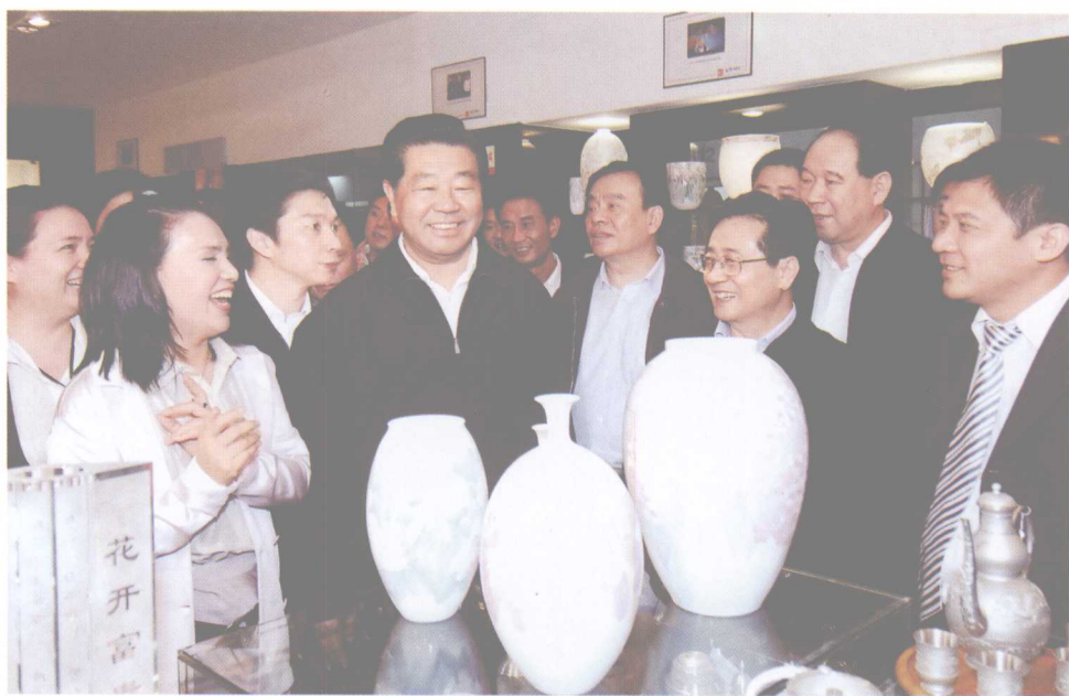
中共中央政治局常委、全国政协主席贾庆林于 2008 年 11 月 7 日视察义乌国际商贸城市场，盛赞义乌“是中国改革开放的一个奇迹”。中共浙江省委书记赵洪祝、省长吕祖善等陪同