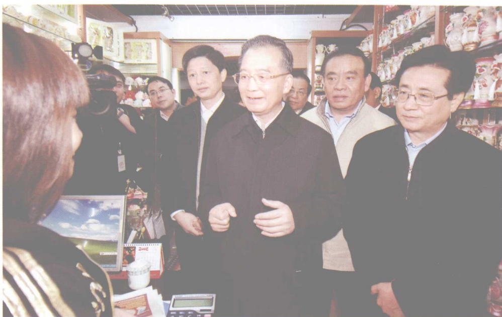
中共中央政治局常委、国务院总理温家宝于 2008 年 11 月 21 日视察义乌国际商贸城市场，称赞浙商“开拓、创新、坚韧、吃苦、灵活”。中共浙江省委书记赵洪祝、省长吕祖善等陪同