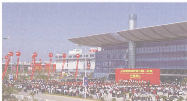
第六代义乌小商品市场——国际商贸城三期一阶段于2008年10月21日开业