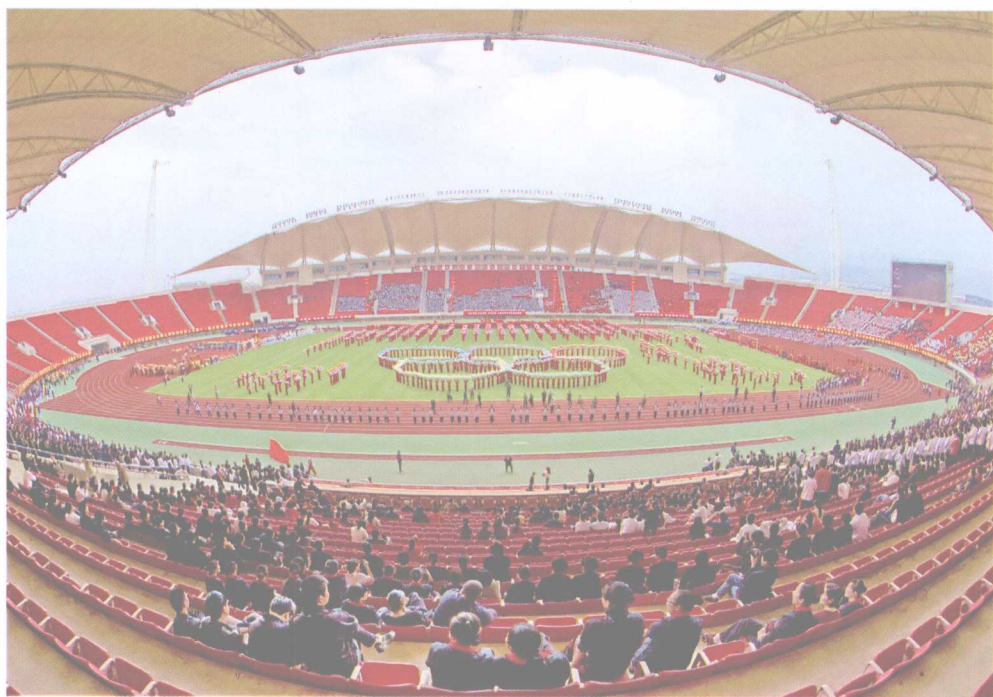
奥运之光——义乌市第十一届全民健身运动节在梅湖体育中心开幕