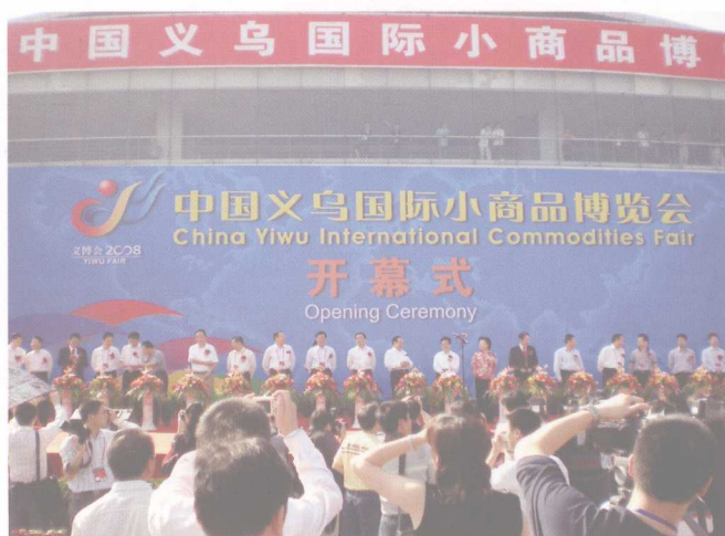
2008 中国义乌国际小商品博览会开幕