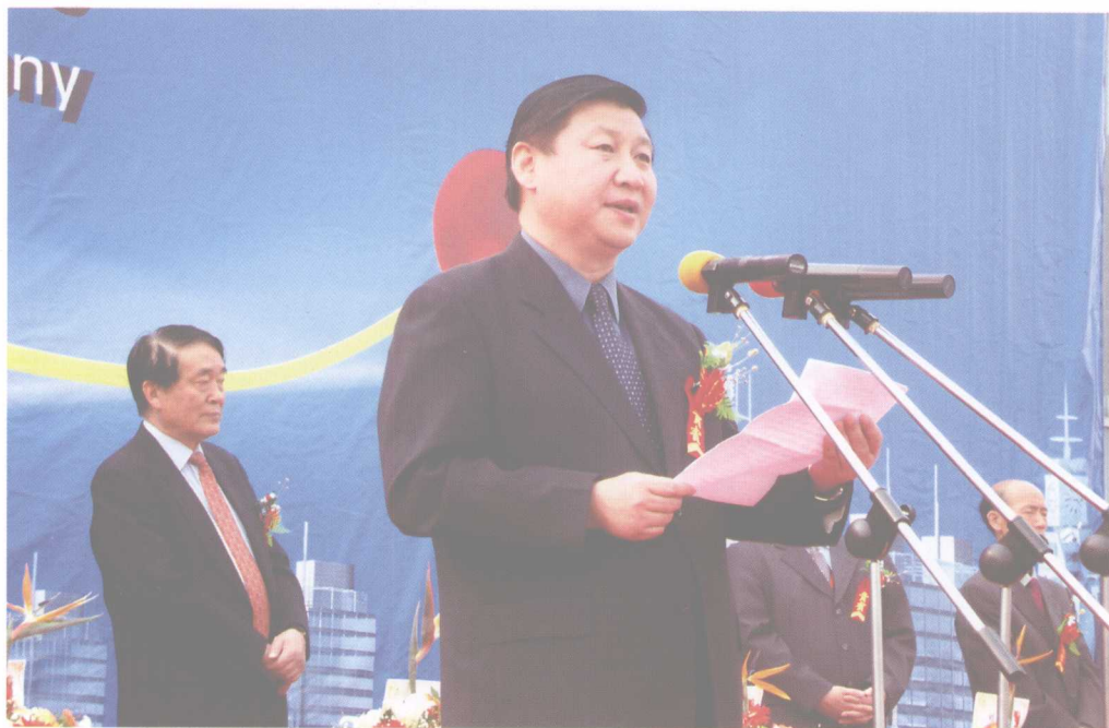
中共中央政治局常委、中央书记处书记、国家副主席习近平(时任中共浙江省委书记)出席中国义乌国际小商品博览会开幕式并发表重要讲话