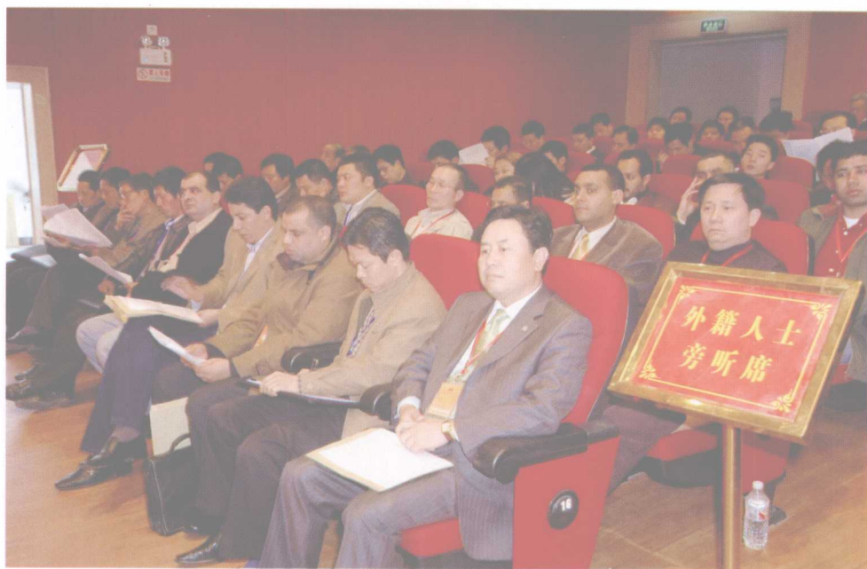
外籍人士代表旁听人代会

（“温家宝总理视察义乌国际商贸城市场”、“贾庆林主席视察义乌国际商贸城市场”由骆贤政提供，“第一代义乌小商品市场”由黄昌根提供，其余由楼子荣提供）