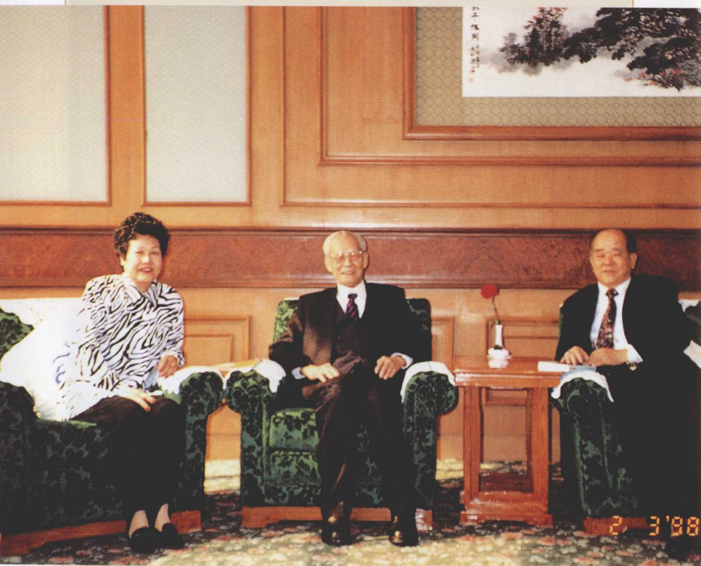
1998年2月3日，全国人大副委员长程思远 (中)在北京钓鱼台国宾馆与周颖南夫妇合影。