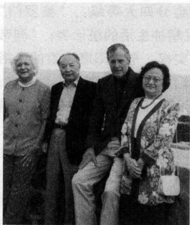
1996年6月，李道豫大使和夫人在美国缅因州海边别墅拜访前总统布什夫妇。

李道豫，祖籍安徽，生于上海，1952年进入外交部，历任外交部国际司副司长，常驻联合国日内瓦代表团副代表，外交部国际司司长。1988年，任外交部部长助理、部党委委员。1990年，任中国常驻联合国代表、特命全权大使。1993年，任中国驻美国特命全权大使。现任中国国际公共关系协会会长。