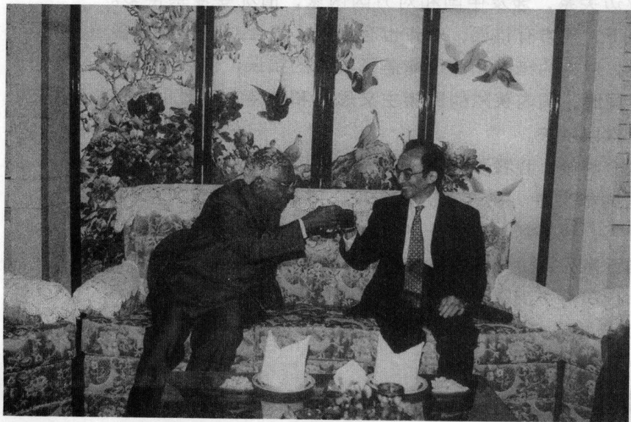
1994年9月30日，程瑞声大使在使馆国庆招待会上同印度副总统纳拉亚南亲切交谈。

程瑞声：邓小平同志在1977年7月恢复工作后，很快就提出了改革开放的思想。我有幸于1978年1月陪邓小平同志访问缅甸，是最早零距离了解他改革开放想法的人之一。陪他出访时，我是亚洲司副司长，主管东南亚外交事务，也担任缅甸语翻译。而他复出后，第一个访问的国家就是缅甸，当时十一届三中全会还没有召开。访问期间，有一天，韩念龙副外长和我陪他吃早饭，邓小平同志先讲了一些赞扬川剧的话。接着，他说要发展旅游事业，中国地方大，名胜古迹多，要多开放一些城市，搞好旅游景点的建设，多办一些旅游公司。这时，我就向邓小平同志汇报，那是1976年，新加坡总理李光耀访华，我陪同他在游览桂林时，他对我说，你们中国把旅游业好好抓一下，每年收入外汇至少可以是20亿美元。当时我根本不信这个话。但邓小平同志听完我的汇报后，连连说道，好好搞几年，肯定能达到，还可以超过20亿美元。