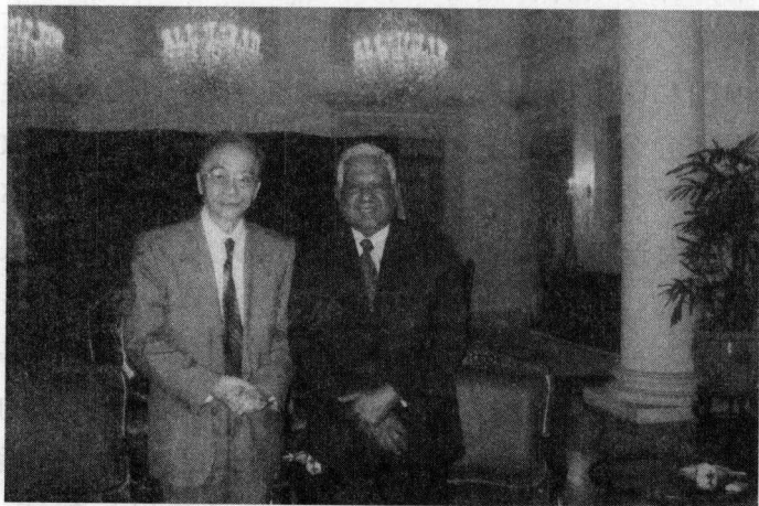
2006年9月24日，程瑞声大使在新加坡拜会新加坡总统纳丹。

我的“万言书”送给中央主要领导后，当时并没有得到答复。但我感到事情正在逐渐发生变化。当时建议调整外交政策的呼声愈来愈高，其中有不少老同志，我的老上级、原驻缅甸大使李一氓也是其中的一位。