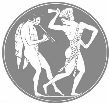
与狄奥尼西奥斯相关的舞蹈，是希腊文化的一个重要组成部分。一个阿夫洛斯管吹奏者为跳舞的姑娘伴奏。

学者们主张亚洲小调是另一种民族乐器的源头。原始的芦管称阿夫洛斯管，看起来像一支小双簧管。在里拉琴和阿夫洛斯管之间，存在着强烈的神话式的对抗。里拉琴，是庄重、温和之神阿波罗的象征；而阿夫洛斯管——弗里吉亚好色的玛息阿 ① 的乐器——代表欣喜若狂。两者之间有一番比拼，玛息阿被击败了，遭到了剥皮的惩罚。古希腊是猎获传奇和神话的绝佳狩猎场地。