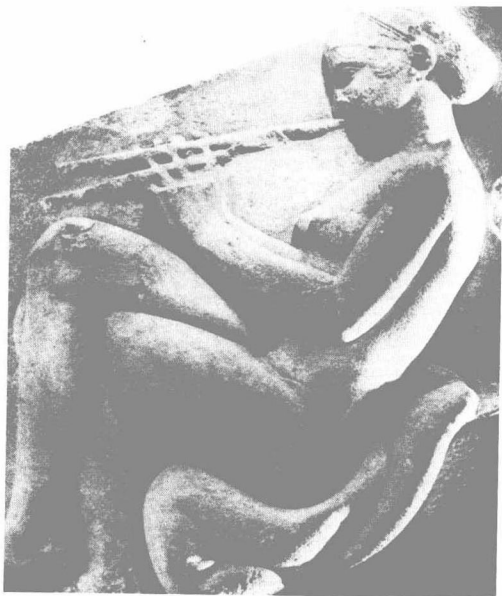
一幅年轻姑娘吹双阿夫洛斯管的浅浮雕。

希腊人有他们的民族乐器，例如，在希腊神话中占据了一席重要位置的里拉琴。你或许读过这个故事：未成年的赫耳墨斯 ⑤ 杀死了一只乌龟，用从长兄阿波罗 ⑥ 那里偷来的公牛内肠制成肠弦，系在乌龟壳上，这就做成了第一部里拉琴。阿波罗为此感到愤怒，赫耳墨斯为了平息哥哥的怒火，让他使用这乐器。自此，阿波罗以第一位里拉琴大师而知名。朝拜阿波罗的中心地最早在得洛斯岛上，后来转至邻近帕纳塞斯山的特尔。