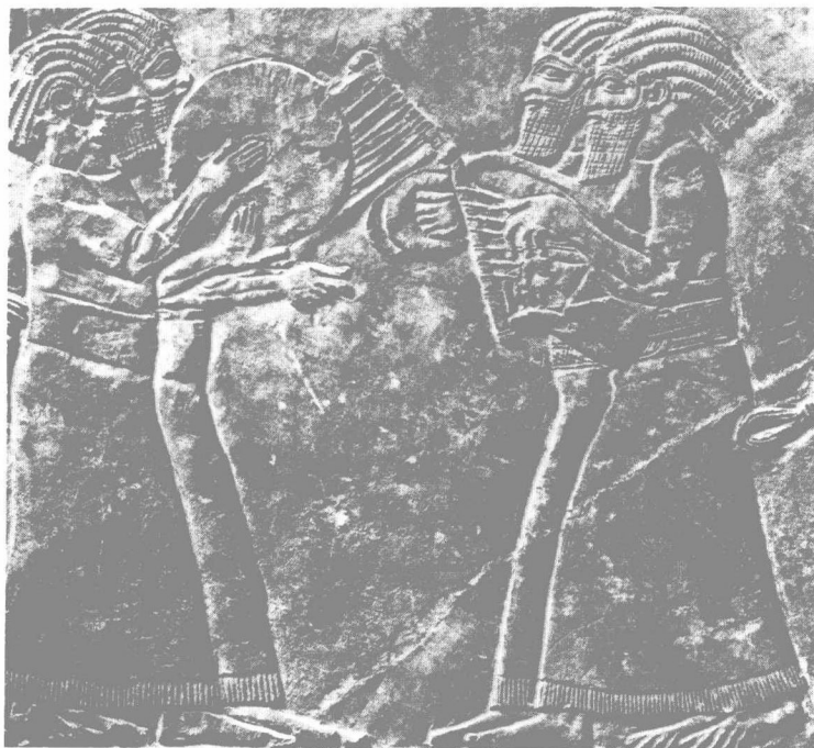
像这幅公元前七世纪的亚述浮雕所表明的那样，钹在远古时期已同军乐结合在一起。

遗憾的是我们不知道这些人奏的乐曲是什么，以及它的声音怎么样。我们没有关于迦勒底人和埃及人所奏音乐门类的文字记载。我们只了解一点关于中国早期的音乐，它由一些符号表示出来。这些符号也应用于诗中，以及用来指示某种道德和政治的规则。