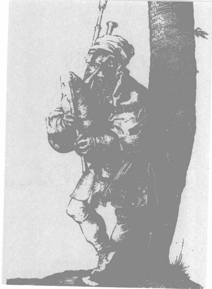
奏风笛者，阿尔布里克特·丢勒作 木刻画。

音乐确实有一种普遍的意义。它影响着年轻人和老人，男人和女人。它带给他们欢乐和悲哀，是他们不可缺少的东西。很难想象一个家庭一天中听不到一点音乐（至少会有一些声音）。我们在各种场所——电梯上，饭店休息室，飞机上——都会被音乐包围，不管我们是否喜欢它。