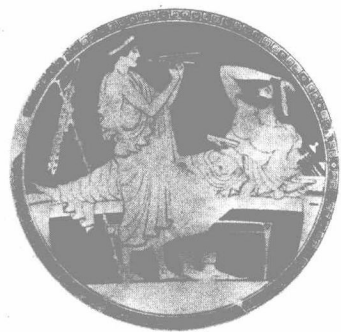
图中之人斜躺着，沉溺于酒和音乐声中。他把手置于脑后，显得如痴如醉。

那时，音乐在希腊也是一门严肃的艺术，并且具有坚实的理论基础。音乐理论，如同我们今天所知道的，它系统地形成于公元前四世纪。塔兰托的亚里士多塞诺斯 ® 是当时重要的理论家，他的影响持续了很多世纪。