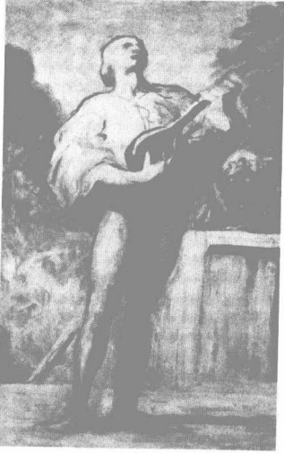
游吟诗人，十九世纪法国 画家沃诺雷杜米埃作。

音乐对不同的人有着不同的意义。对一些人，音乐是做家务（或阅读、玩耍、遐思）之际收音机或录音机发出的声音；对另一些人，音乐意味着音乐厅的傍晚，教堂的管风琴，爵士乐的节奏，电视上的歌曲，录制的海费兹（1901-1987）、卡萨尔斯（1876-1973）或鲁宾斯坦（1829-1894）的协奏曲。