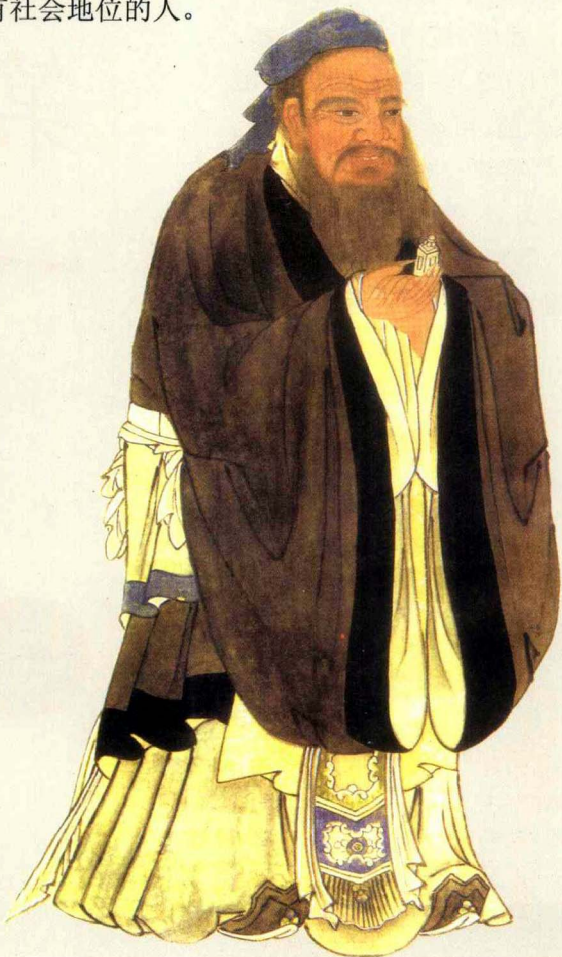
◀ 孔子行教像，传为唐代吴道子绘，此为明代摹本，在众多孔子像中属上乘之作

这是流传千古的名言，同时也反映了《论语》一书特有的语言风格：朴实、真挚、内涵丰富而又充满智慧。在此需要注意的是：人们通常把“学而时习之”的“习”理解为复习、温习的意思，这种理解并不确切，应该理解为实习或实践。