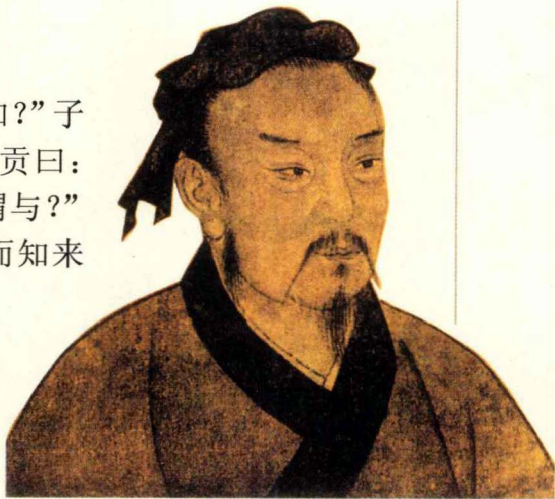
▲ 子贡像，选自《孔子圣迹图》