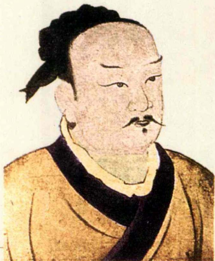
◀ 曾子像,选自《孔子圣迹图》

1.4 曾子 ① 曰:“吾日三 ② 省(xǐng) ③ 吾身 ④ :为人谋而不忠乎?与朋友交而不信乎?传(chuán) ⑤ 不习乎?”