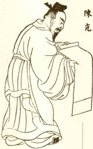
▲ 子禽像，选自绘于明代的《圣迹图》

1.10 子禽 ① 问于子贡 ② 曰：“夫子 ③ 至于是邦也，必闻其政。求之与？抑 ④ 与之与？”子贡曰：“夫子温、良、恭、俭、让以得之。夫子之求之也，其诸 ⑤ 异乎人之求之与？”