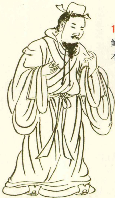
▲ 有子像,选自“七十二贤人”肖像画

1.2 有子 ① 曰:“其为人也孝弟(tì) ② ,而好犯上者,鲜 ③ 矣;不好犯上,而好作乱者,未之有也。君子务 ④ 本,本立而道生。孝弟也者,其为仁 ⑤ 之本与 ⑥ !”