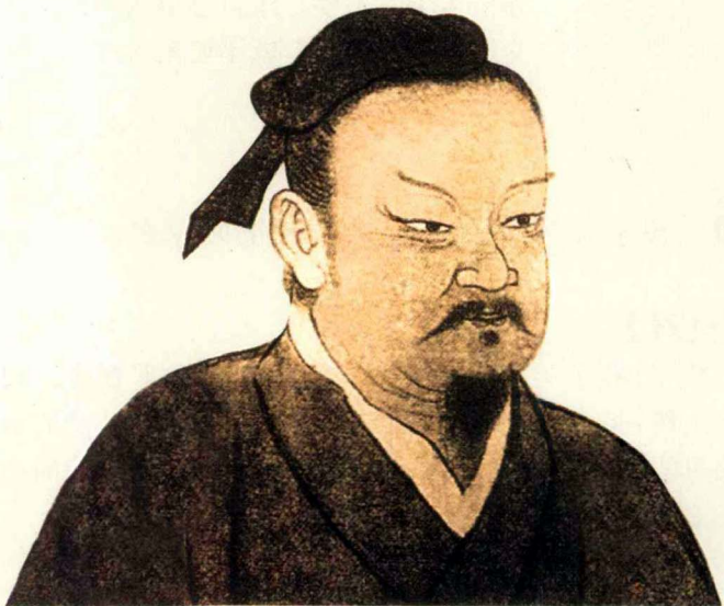
► 子夏像，选自《孔子圣迹图》

1.7 子夏 ① 曰：“贤贤 ② 易 ③ 色 ④ ；事 ⑤ 父母，能竭其力；事君，能致 ⑥ 其身；与朋友交，言而有信。虽曰未学，吾必谓之学矣。”