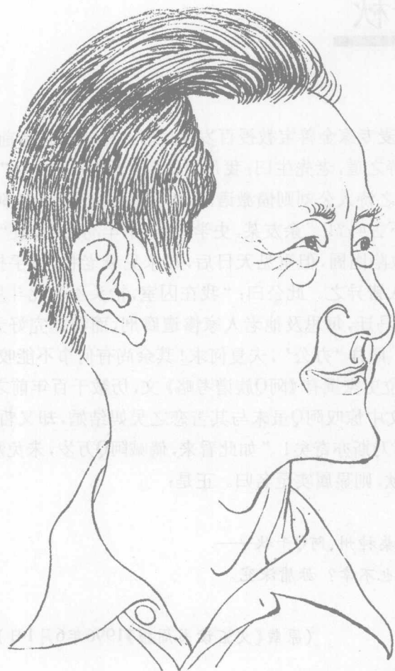
叶春阳漫画像 丁聪画