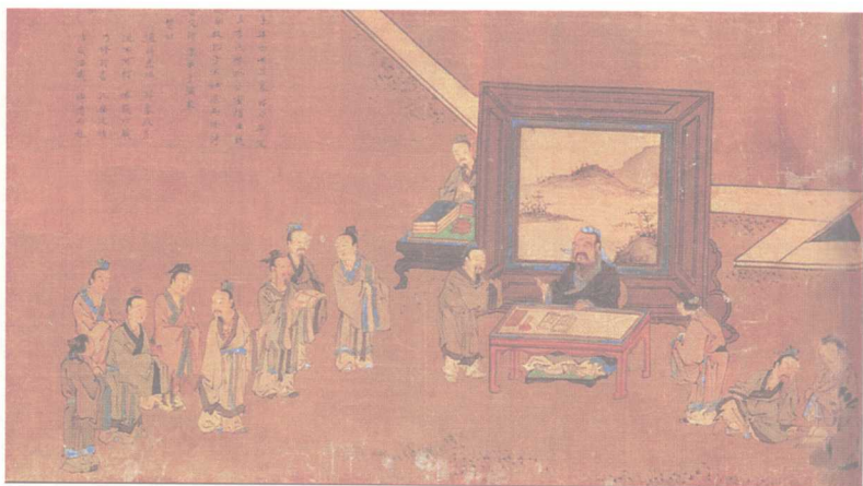
彩图4 孔子不仕退修诗书