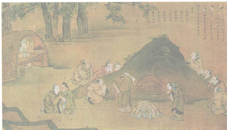
彩图6 孔子弟子守丧