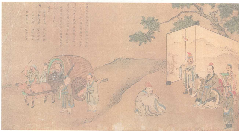
彩图3 孔子去齐返鲁