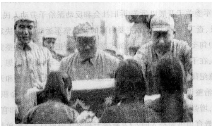
解放军高级将领为民众颁发锦旗

东北解放军的武器装备大大加强，以第1纵队为例，1946年战争初期，该纵队配备各种枪1.3991万枝(挺)，其中冲锋枪92枝；各种火炮46门，其中75毫米山炮12门。到1948年8月，全纵拥有各种枪1.6438万枝(挺)，其中长短枪1065枝。轻机枪772挺，重机枪175挺，高射机枪6挺；各种炮681门，其中六〇炮243门，迫击炮50门，战防炮17门，火箭炮38门，步兵炮13门，山炮30门，野炮13门，榴弹炮9门，以及平射炮等。