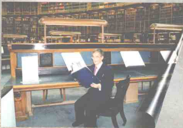
作者在大英图书馆（二〇〇一年十月八日）