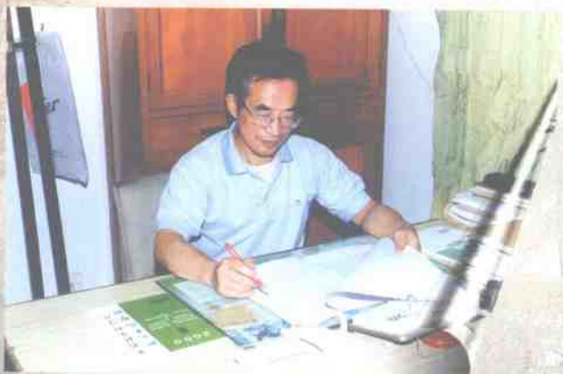
作者在中国社会科学院研究生院学报编辑部工作（二〇〇〇年）