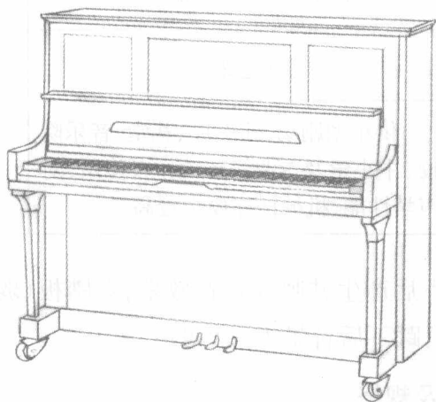
图 1-1 立式钢琴

1855年,德籍美国人斯坦威(Henry Steinway)创造了世界上第一架三角钢琴(见图1-2),成为现代钢琴的典型,后来斯坦威分别在纽约和汉堡设厂,生产世界著名的斯坦威钢琴,经过世界权威钢琴演奏家们的一致推荐,斯坦威牌三角钢琴被公认为是世界上质量最好的钢琴。