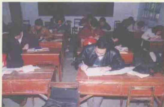
国税局率先在市推行公务员制度。图为闭卷考场一角