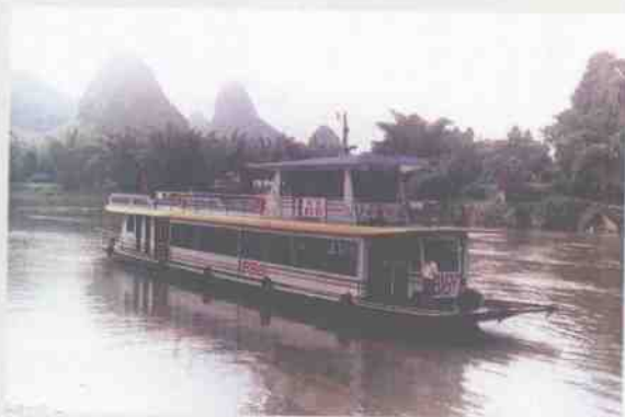
阳朔旅游贸易建设总公司冲江船队游览船