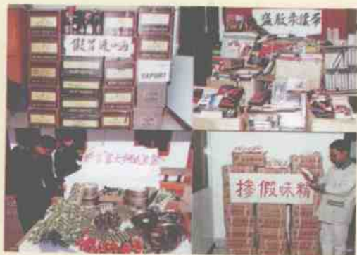
加强执法力度，狠狠打击假冒伪劣产品