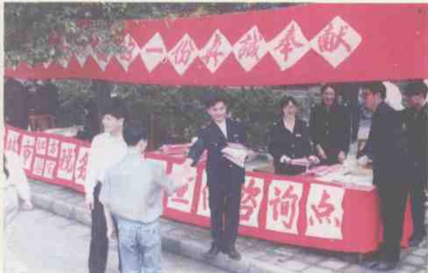
公、检、法、司、国税、地税联合上街宣传税法