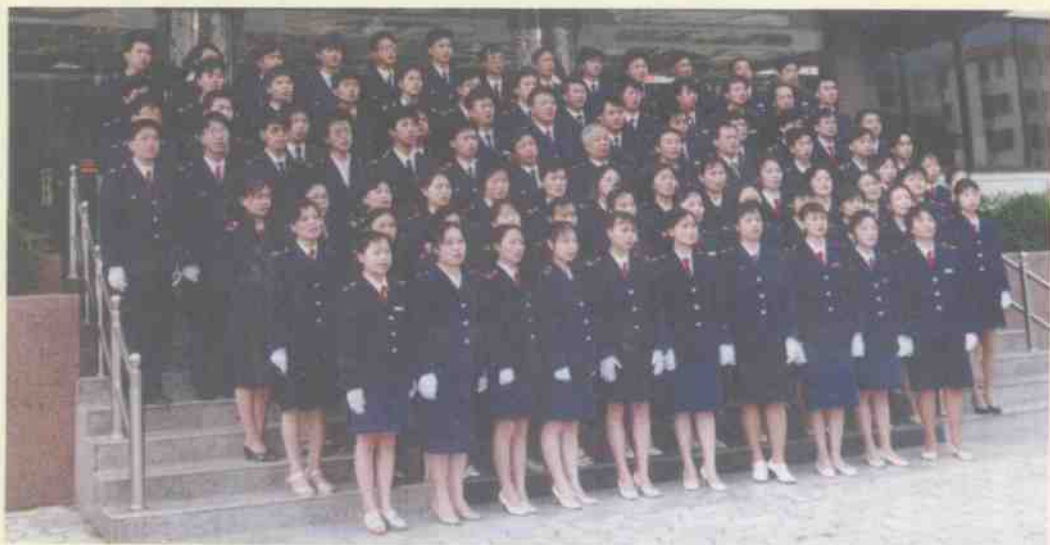
同声高歌“没有共产党就没有新中国”