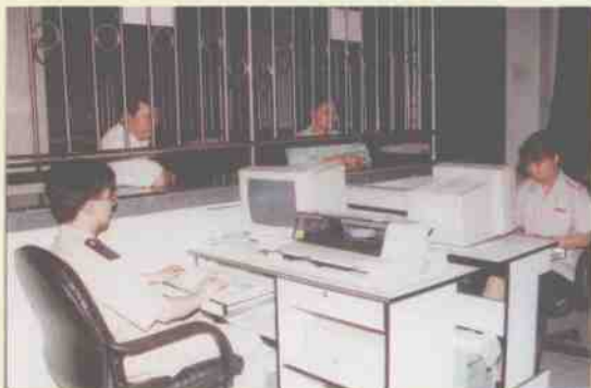
市国税局12个征收分局全部建立办税大厅，使用电脑进行税收征管