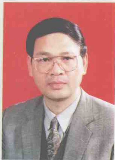
中共阳朔县委书记 唐祖铭

1995年，阳朔县经济持续、快速发展，全年完成国内生产总值7.28亿元，比上年增长35%，固定资产投资完成1.30亿元，农民人均纯收入达到1 518元。经过“八五”时期的建设，阳朔