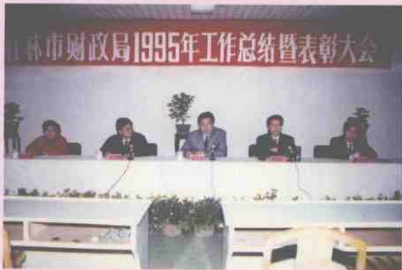
1996年1月26日，市长黎明智参加市财政局1995年度工作总结暨表彰大会并作重要讲话。