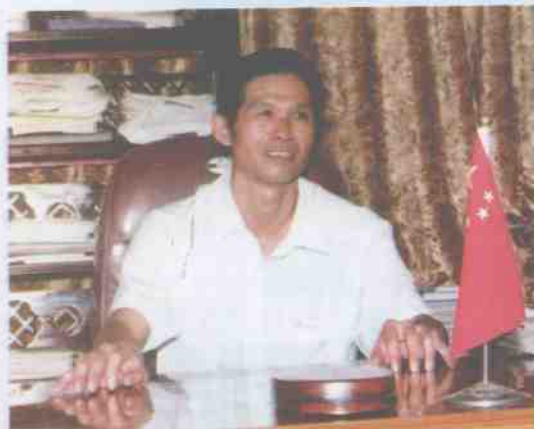
中共临桂县县委书记 阳春喜