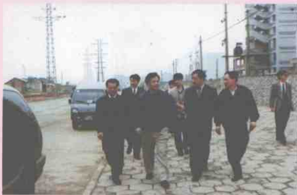
1995年4月25日财政部副部长张佑才到桂林视察桂林高新技术产业开发区。