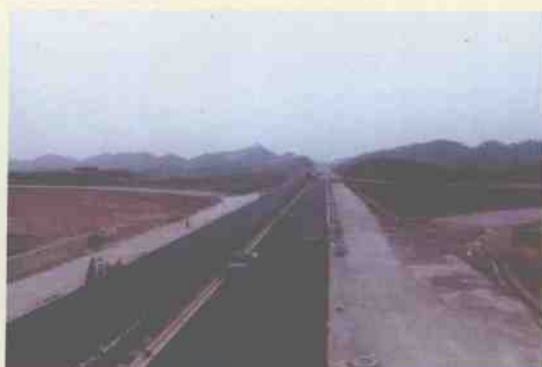
桂林两江国际机场道路在加紧建设中