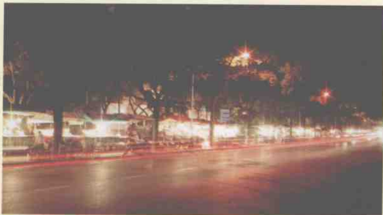
桂林市滨江路 旅游工艺品夜市市场 一角。