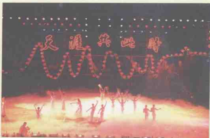
1995年9月9日桂林市举办第四届山水旅游节。图为旅游节“天涯共此时”文艺晚会演出盛况。