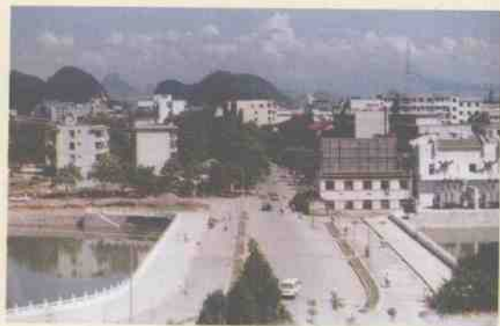
1995年新(扩)建的观澜桥