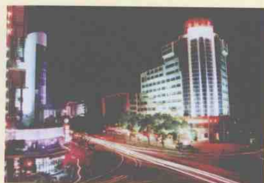
中山南路街道夜景焕然一新