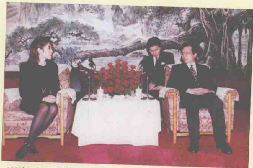
1995年10月14日桂林市市长黎明智亲切会见泰国公主朱拉蓬哇莱拉。