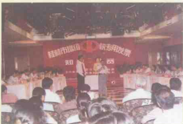
桂林市“蓝宇三环标”增值税专用发票知识大赛

1995年，桂林市国家税务局认真贯彻执行党的路线、方针和国家政策法规。进一步巩固和完善了新税制；以自查和重点检查的方式组织开展新税制实施后的的限踪检查工作。坚决把国税工作重点转移到基层、转移到征管。坚持以组织国家税收收入为中心，全年市国税系统(含临桂县、阳朔县)组织工商税收收入库63 581万元，比上年增长10.10%。推进以票管税，建立和完善了增值税发票管理制度。建立健全纳税户纳税档案，全年共办理税务登记6 984户。年审验证4 878户企业，10 534户个体工商户。扎实抓好国税系统干部队伍的思想政治建设，持之以恒开展反腐倡廉，全局形成人人关心国税入库，个个组织国税