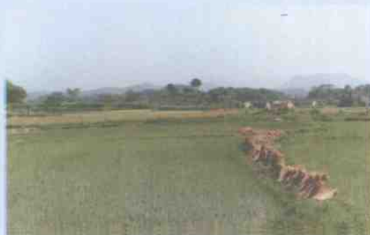
粮食生产基地一角