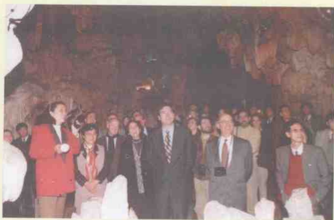
1995年3月2日西班牙参议院院长胡安·何塞·拉沃阿尔达(中)参观桂林芦笛岩。