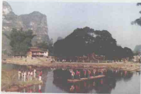
古榕公园刘三姐民俗风情表演

目前，阳朔县政府以“阳朔中国旅游第一县”为指导思想，正多方组织资金，充分利用本县的资源优势，抓住机遇，加强硬件建设，力争旅游业在“九五”期间再创佳绩。