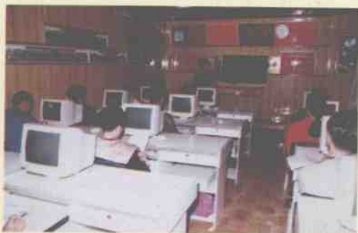
积极推行微机管理，加强微机培训

全年全市发展个体工商户6 328户，净增5 095户，使桂林市个体工商户在总量上首次突破15 000户的大关，达到15 067户，从业人员23 412人，注册资本8 709.6万元，分别比上年增长50.7%，50.5%和60.02%；私营企业猛发展到388家，比上年增长4.67倍；全国最大的私营企业希望集团也在桂林市安家落户。