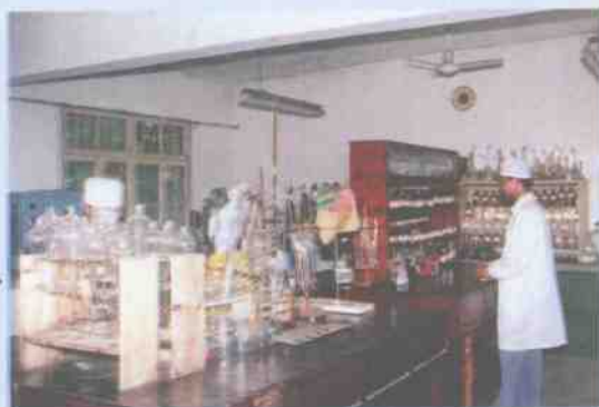
临桂县制药厂化验室

临桂县委、县政府继续以邓小平建设有中国特色社会主义理论为指针,进一步营造大环境,构筑新优势,加大招商引资力度,为“九五”计划和2010年长远规划开好头、起好步实现全县经济超常规发展。