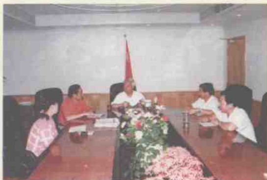
局党组成员在研究工作

征收的良好局面。坚持依法治税与发展经济有机结合，促使国税工作为振兴桂林经济作出了贡献。