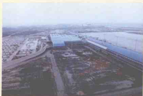
即将建成的桂林两江国际机场。图为机场候机楼一角。