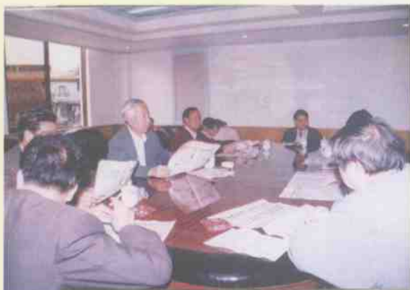
局领导和中层干部在学习“九五”规划

1995年，桂林市国家税务局认真贯彻执行党的路线、方针和国家政策法规。进一步巩固和完善了新税制；以自查和重点检查的方式组织开展新税制实施后的的限踪检查工作。坚决把国税工作重点转移到基层、转移到征管。坚持以组织国家税收收入为中心，全年市国税系统(含临桂县、阳朔县)组织工商税收收入库63 581万元，比上年增长10.10%。推进以票管税，建立和完善了增值税发票管理制度。建立健全纳税户纳税档案，全年共办理税务登记6 984户。年审验证4 878户企业，10 534户个体工商户。扎实抓好国税系统干部队伍的思想政治建设，持之以恒开展反腐倡廉，全局形成人人关心国税入库，个个组织国税