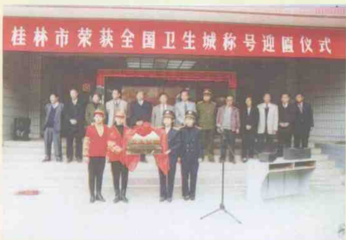
1995年桂林市荣 获全国卫生城称号。 图为桂林市举行隆重 的迎匾仪式。