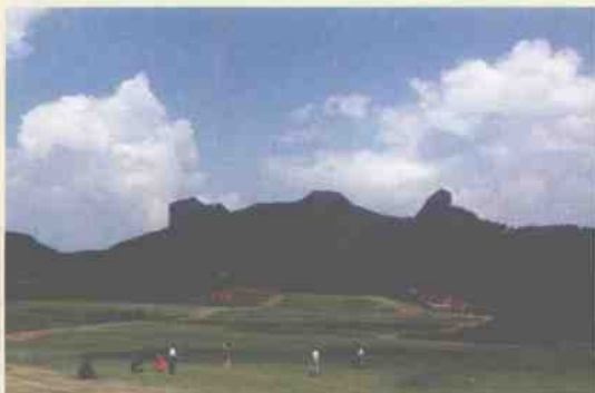
郊区山水高尔夫球场地一景