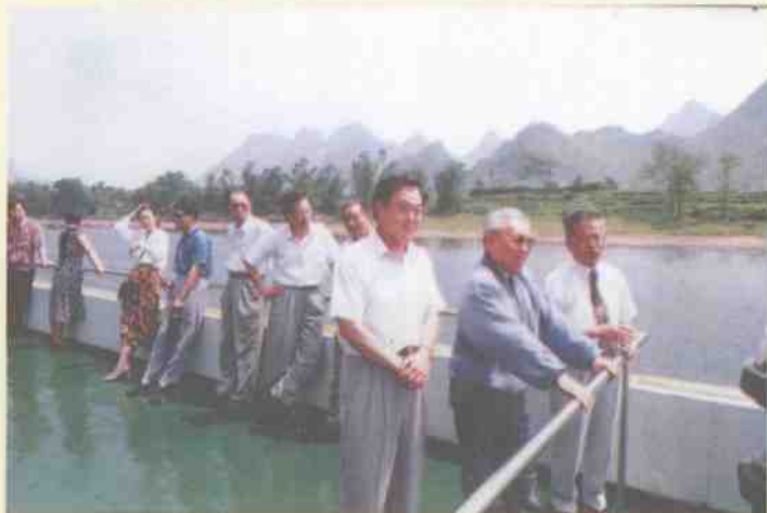
全国政协副主席 杨汝岱1995年5月14 日在中共桂林市委书 记张文学、桂林市政 协副主席揭廷魁的陪 同下游览漓江。