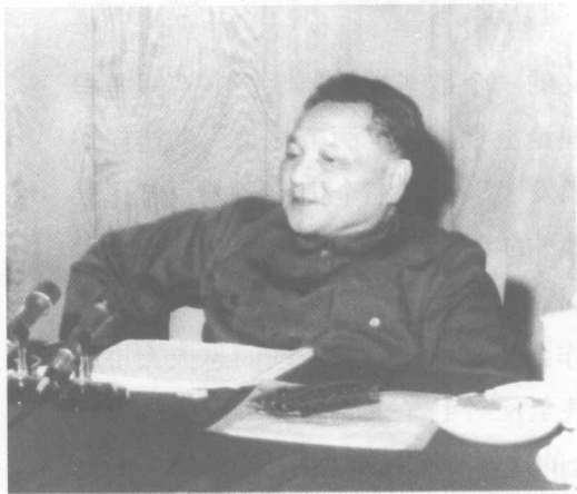
1978年12月邓小平在党的十一届三中全会上

与会者对主张“两个凡是”、反对“实践是检验真理的唯一标准”的同志进行了批评，认为“两个凡是”背离了党的实事求是的思想路线。这次会议，实际上成了纠正“左”倾错误、进行拨乱反正的会议。