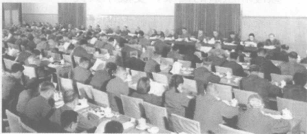
党的十一届三中全会会场

1978年12月召开的党的十一届三中全会，开启了改革开放的历史新时期，影响和改变了中国历史的发展进程，实现了伟大的历史性转折。从那时起，改革开放成为当代中国的主旋律。