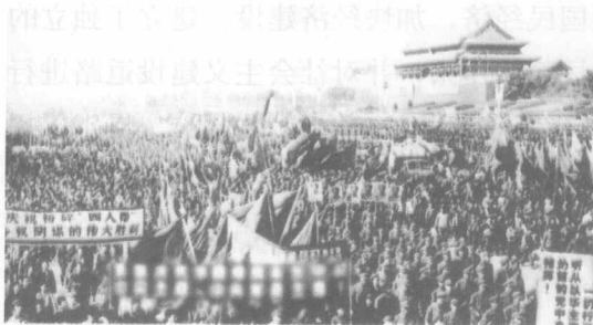
1976年10月，首都各界群众在天安门广场庆祝粉碎“四人帮”胜利

望把被“四人帮”颠倒了的是非重新扭转过来，希望把被“四人帮”耽误的时间和造成的损失夺回来，希望尽快为“天安门事件”等重大历史冤案平反，并尽快恢复