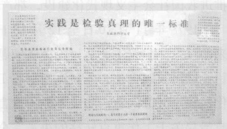
刊有《实践是检验真理的唯一标准》文章的《光明日报》

对“两个凡是”进行批判，不仅邓小平等老一辈革命家率先上阵，还有理论战线上那些坚持真理、忧国忧民的知识分子也踊跃参与。正是在这样的背景下，一篇重要的文章应运而生。1978年5月11日，《光明日报》发表了《实践是检验真理的唯一标准》的特约评论员文章，当天新华社转发了这篇文章。文章论述了马克思主义“实践第一”的观点，强调检验真理的标准只能是社会实践，