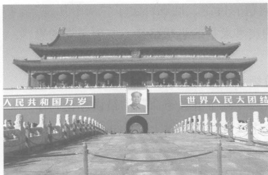
悬挂在天安门城楼上的毛主席巨幅画像

东巨幅画像。也许你不会想到，30年前，天安门城楼是否继续悬挂毛泽东画像，曾引起国内外许多人的关注。