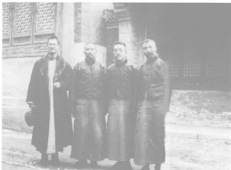
◎ 胡适（右二）同蔡元培（左二）、蒋梦麟（左一）、李大钊（右一）同游北京西山卧佛寺（1920年3月14日）