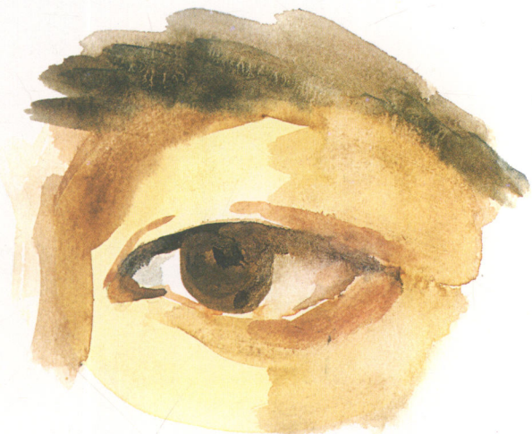
由上下眼睑包住的眼睛

鼻子底部有五块软骨构成,两块形成鼻孔,第三块把鼻孔分开,另两块形成鼻尖。鼻子的各部分随着年令的增加而增长,改变。鼻子上部分是骨头,它决定鼻子的基本形状。