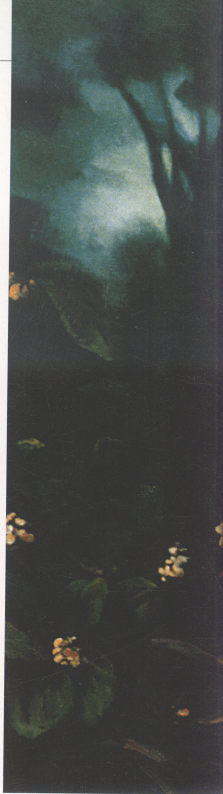
姚 铭 画