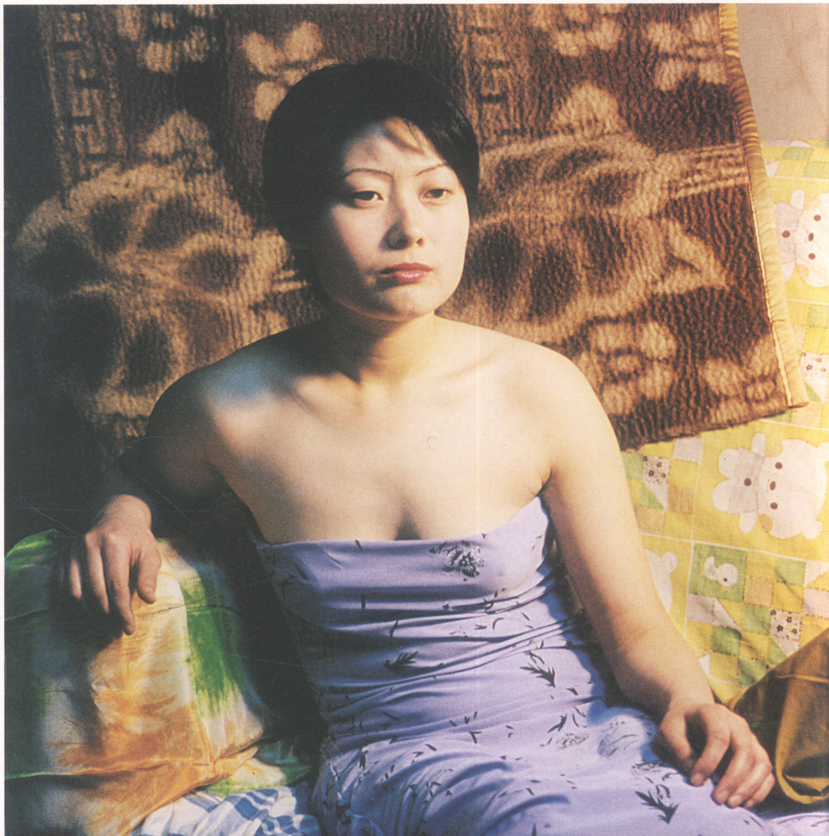
人物位置构图较合适

肖像画的构图十分重要。我们现在把构图的重要性与肖像画的作画技巧视为等同位置。实际上一幅肖像画如果构图不好,那么无论脸画得多么出色,这幅画也不会有吸引力。当一位少女坐在你的面前,在画之前,那么首先就应考虑构图。怎样将你要画的肖像妥当地、艺术地安排在你事先准备的画布上,大小、上下、前后要认真考虑,那么它所出现的就是一个设计问题,与其它主题构图中出现问题一样,它遵循的规律也一样。