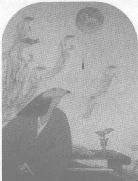
卧薪尝胆的越王勾践，有着超强的自我力量