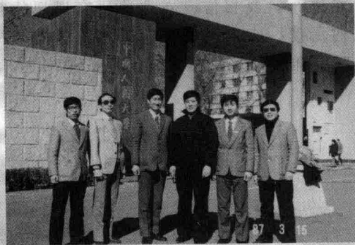
作者与人民大学同学在一起（1987年）