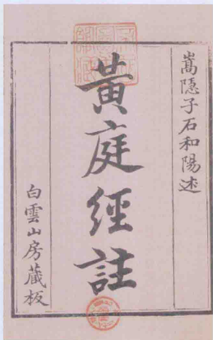
清嘉庆十四年李明初刊 明石和阳《黄庭经注》