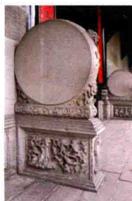
首进正门石鼓基座

木棉花每年农历二、三月份先开花，后长叶，花冠五瓣，橙黄色或橙红色，极为美丽。古代广州木棉树种植很广，广州人对木棉花有着特殊的感情，现为广州市市花。木棉树属于速生、强阳性树种，树冠总是高出附近周围的树群，以争取阳光雨露，木棉这种奋发向上的精神及鲜艳似火的大红花，被人誉之为英雄树、英雄花。此图雕木棉花开，鸟雀集聚，寓意春回大地，万物新生。