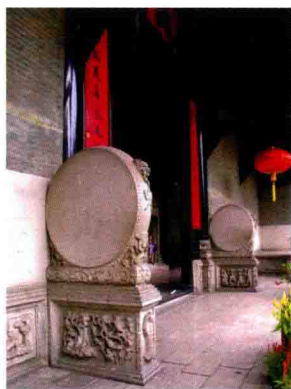
首进正门两侧石鼓基座

正门两侧石鼓基座。男性为日神，女性为月神。他们手拿阴阳镜、照妖镜，有驱除邪恶的用意。日神、月神是我国原始社会自然崇拜的对象。自然崇拜，就是对天地、日月星辰、山川草木、江河湖海、云雷雨电等等这些自然属性的崇拜。