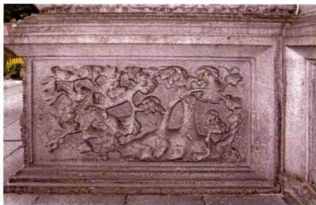
首进正门石鼓基座

荔枝为岭南佳果，因其与“利子”谐音，便被视为祈子吉祥物；葡萄多籽也常作为多子多孙的象征；老鼠繁殖能力强，又为十二生肖之首，有“子鼠”之称，三者巧妙构成的图案寓意子孙兴旺。