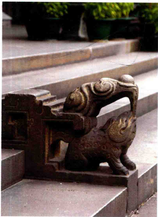
首进正门台阶石垂带

金蟾是民间传说中能吞吐金钱的灵物，性喜咬钱，民间尊称旺财神兽，闽南话“金蟾”与“金钱”谐音，福州人喜欢把金蟾口衔铜钱当作招财进宝的象征。此雕饰为金蟾口吐瑞气，寓意吉祥。