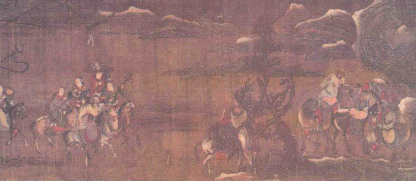
《昭君出塞》(局部) (宋)赵伯驹