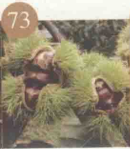
天津板栗（天津产区）