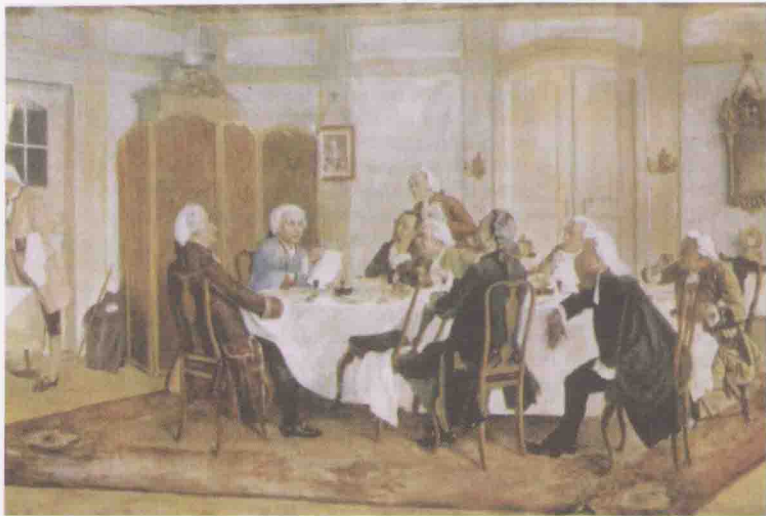
1900 年左右绘制的油画《康德家的聚餐会》