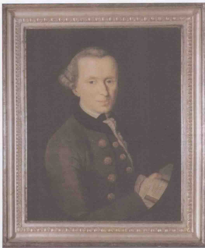
1786年由贝克尔（Becker）绘制的康德肖像