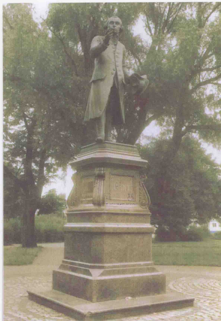
哥尼斯堡大学前的康德铜像