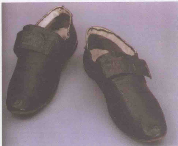
1800年左右康德穿过的皮鞋，黑色山羊皮，鞋码为 26.5 厘米，鞋带上有康德的标记