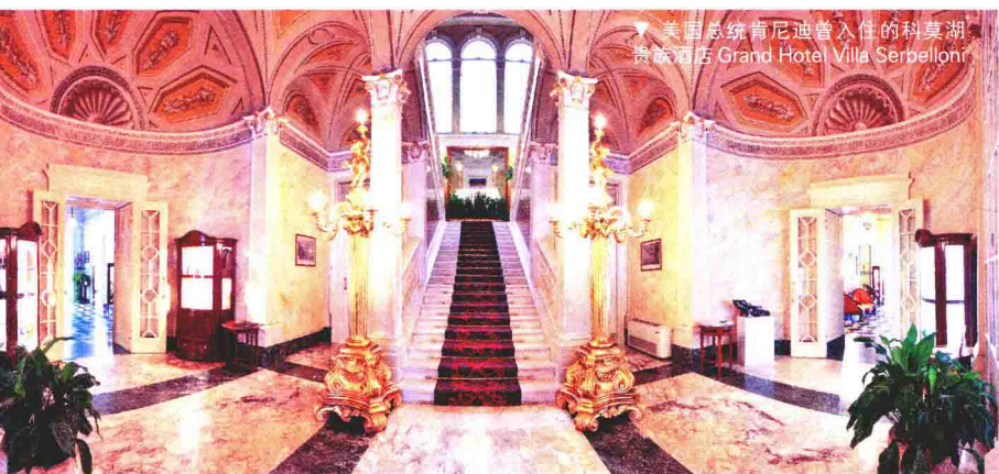
美国总统肯尼迪曾入住的科莫湖 贵族酒店 Grand Hotel Villa Serbelloni