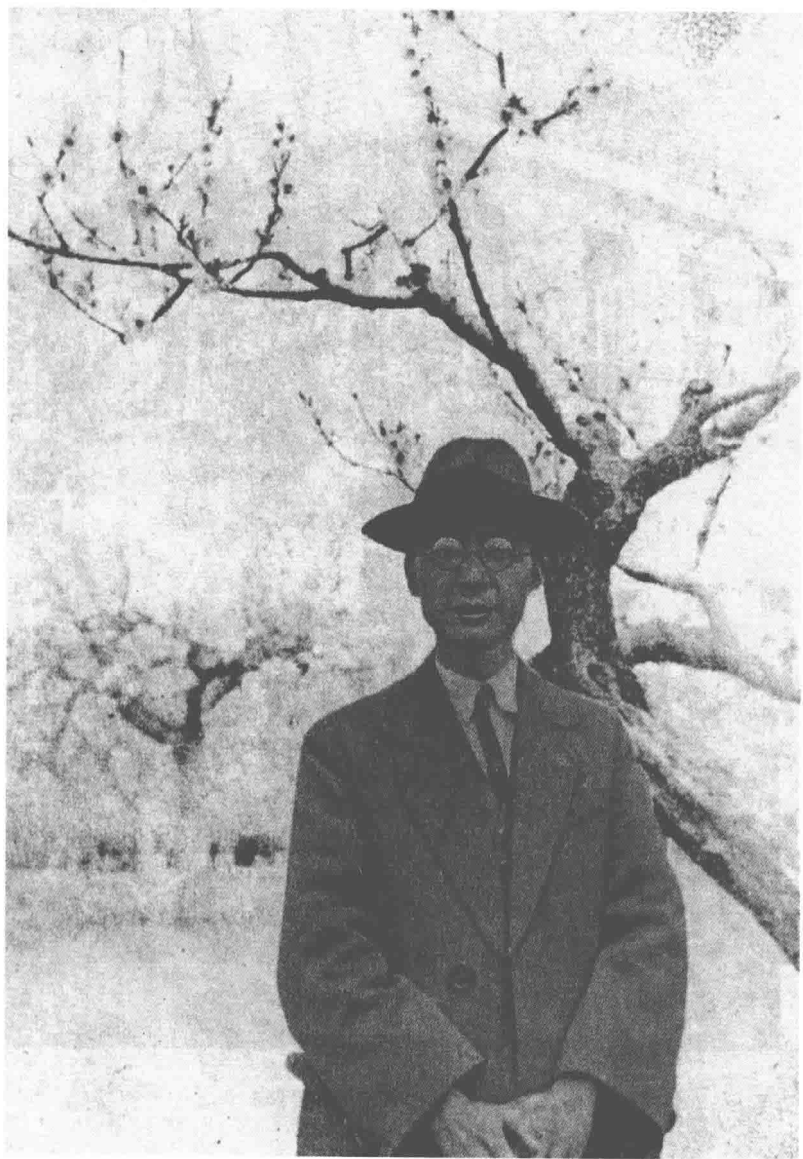
1936年老舍创作《骆驼祥子》时摄于青岛。