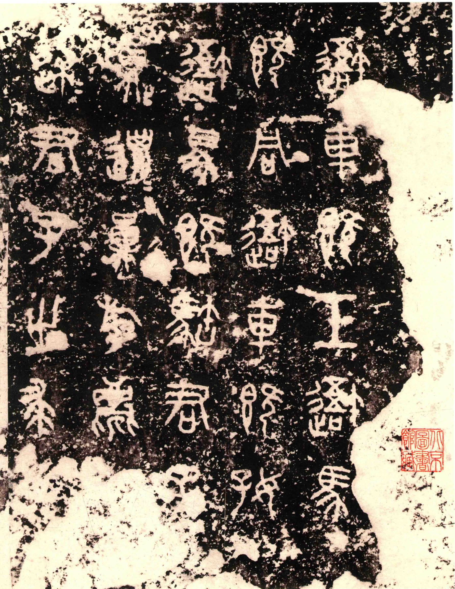
1 石鼓文 善拓 155 战国秦献公十一年（前三七四）