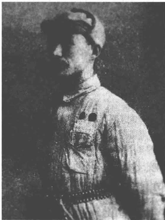
1949年迟浩田在浙江嘉兴

鬼子扫荡结束，他将看到的情景一一报告给县大队大队长王敬亭。此举让王敬亭颇感震惊。小小年龄能有如此的胆量，绝非等闲之辈。因此，迟浩田破格参军进入县大队。也是那次日军的扫荡，迟浩田的村庄被糟塌得惨不忍睹，被杀被奸被烧的情景，深深地刺痛了迟浩田。从此，他心中埋下了民族之恨。