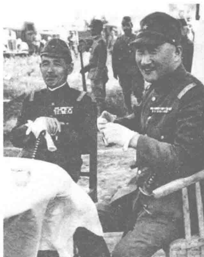
畑俊六（左一）因受枪伤而干瘦如柴