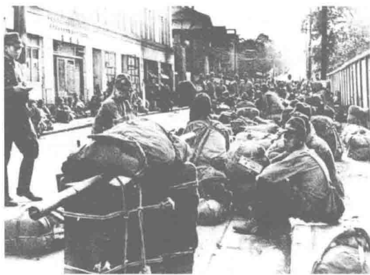
侵占了徐州的日军只想着该怎样摆“庆功宴”

虽然早已人去城空，但无论“华中派遣军”还是“华北方面军”，都没有在后面死死尾追，沿途也没有遇到太强的阻截，显然，这与日军上上下的功利心态有关。这帮人的主要力量都没有拿来对付突围部队，他们满脑子转来转去的，还是如何在同仁面前争得头功，以及怎样在徐州大摆“庆功宴”。