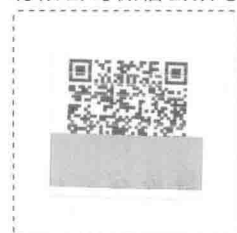
本册图书激活二维码

刮开右面的二维码，使用“北京大学医学出版社有限公司”微信公众号中右下角的“扫一扫”功能，激活本册图书的增值服务。