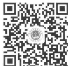
北京大学医学出版社 有限公司微信公众号

打开微信，利用“发现”中的“扫一扫”，扫描“北京大学医学出版社有限公司”微信公众号二维码，关注北京大学医学出版社微信公众号。