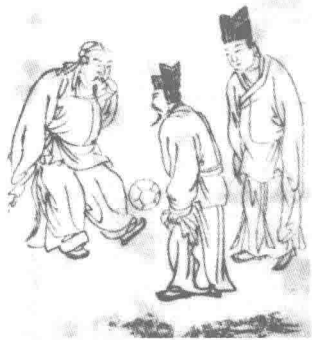
图 1-1-2 蹴鞠三人场户

宋朝的皇帝和贵族都很喜欢蹴鞠活动，并在朝廷的礼仪中把蹴鞠定为朝廷大宴表演的项目之一。受其影响，在北方建国的辽国、金朝也将蹴鞠作为宴会表演节目。在宋代，为了满足人们的文化娱乐需要，城市中有了综合性的游乐场——瓦舍，瓦舍中有供艺人演出的勾栏，蹴鞠也是在勾栏中进行的各种演出活动之一。另外，各种艺人还组织了自己的团体——会社。蹴鞠艺人的会社就叫齐云社。早在汉唐时期，皇室和贵族的家中就有专业的蹴鞠艺人，称为“鞠客”、“内园小儿”，是专为统治阶级从事表演活动的。宋代的朝廷也有专业蹴鞠艺人，而城市瓦舍中的蹴鞠艺人则是民间的，是为市民表演娱乐的。