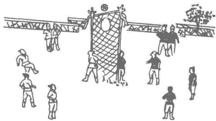
图 1-1-1 唐代单球门蹴鞠图

但开展得不够广泛。另一种是没有球门的个人比赛，称为白打，有1人场，2人场……直到10人场（图1-1-2），这种踢法历史最久，开展得很广。