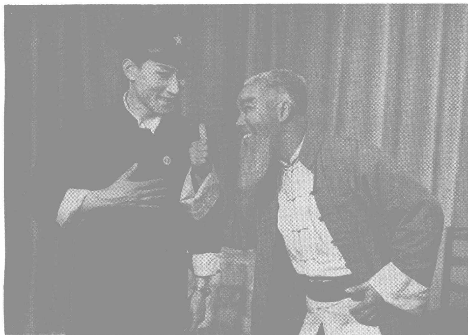
江苏省演出团剧照