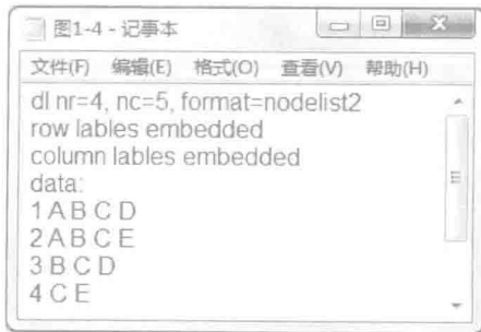
图 1-5 (b) 用“文本编辑器”输入初始发生阵

(2) 利用文本编辑器输入。在 Ucinet 软件中，常见的数据输入方法是在一个文本文件中输入数据，可以利用任何一种字处理程序，如“写字板”或者“Microsoft Word”；或者在 Ucinet 单击“File→Text Editor”，打开文本编辑器，也可以输入数据文件。采用关联列表形式（linked list formats）输入数据，只需指定数据中实际有关联的关系。关联列表形式可分为两类：点列表（nodelists）和边列表（edgelists）。点列表形式（nodelist format）又为两小类：①点列表形式-1（nodelist1），用于输入 1-模方阵数据；②点列表形式-2（nodelist2），用于输入长方形的 2-模矩阵数据；两者都只能用来输入 1-0 矩阵数据。由于公司-董事发生阵是 2-模矩阵，故采用点列表形式-2（nodelist2），在文本编辑器中输入相应语句（见图 1-5（b））。