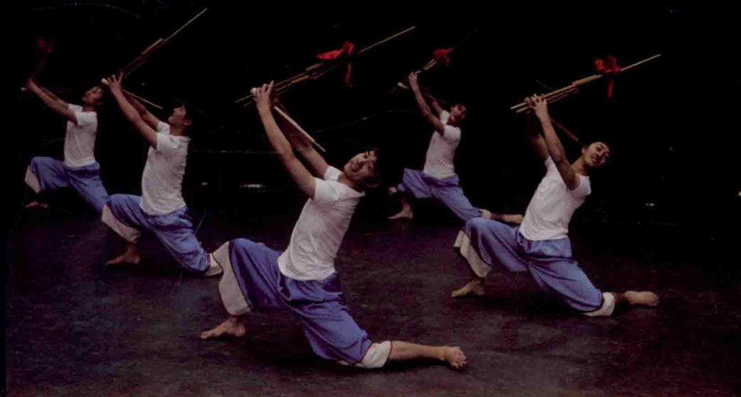
《中国民族民间舞特色教程》之苗族《芦笙舞组合》进入北京舞蹈学院继续教育学院培训课堂