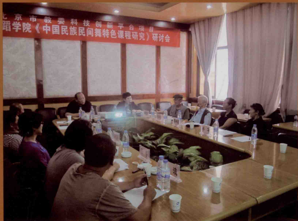
2013年于云南昆明翠湖宾馆召开《中国民族民间舞特色教程》研讨会