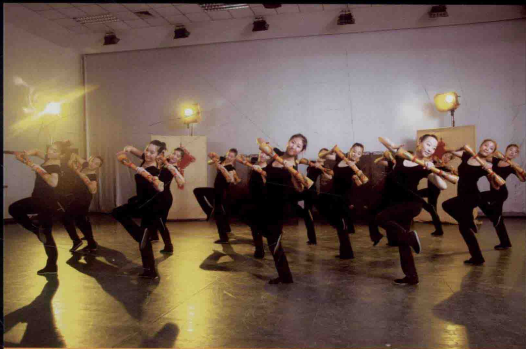
《中国民族民间舞特色教程》之瑶族舞蹈进入继续教育学院本科课堂