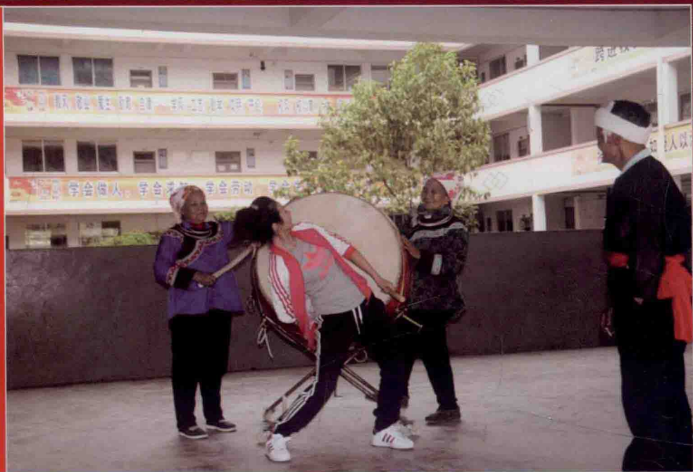
2013年贵州黔东南州榕江县苗族反排木鼓舞采风