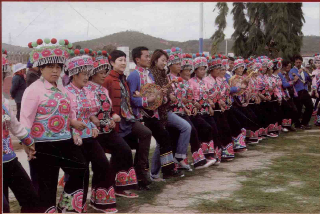
2011年云南楚雄州牟定县左脚舞采风