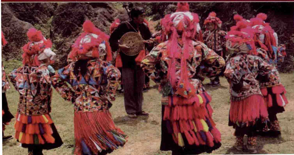
西畴县花保寨采风