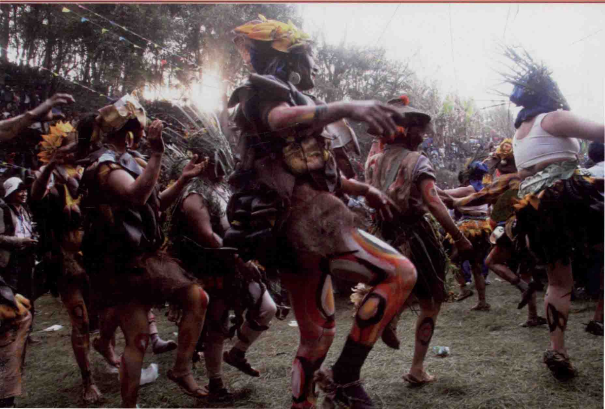
2012年云南红河州弥勒县彝族火把节采风