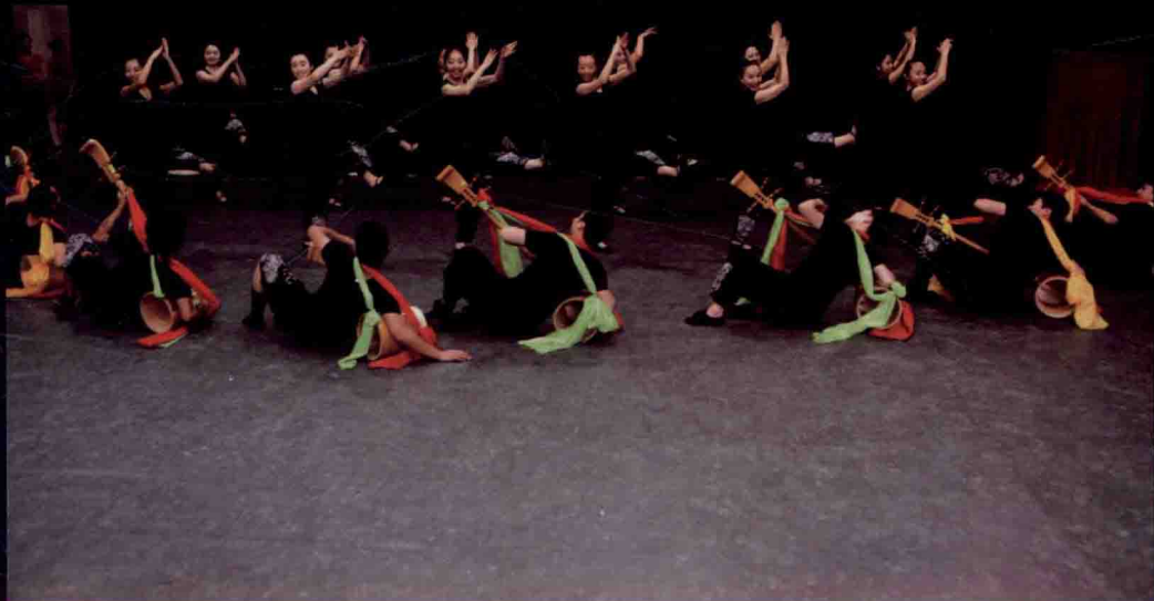
《中国民族民间舞特色教程》之彝族《阿细跳月组合》进入北京舞蹈学院继续教育学院培训课堂