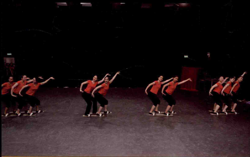
《中国民族民间舞特色教程》之壮族《板鞋舞组合》，进入北京舞蹈学院继续教育学院培训课堂