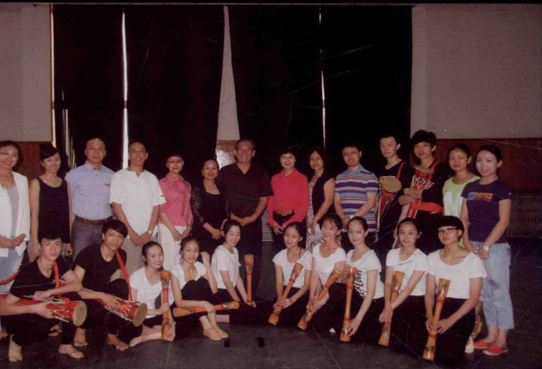
《中国民族民间舞特色教程》之瑶族舞蹈进入北京舞蹈学院本科课堂