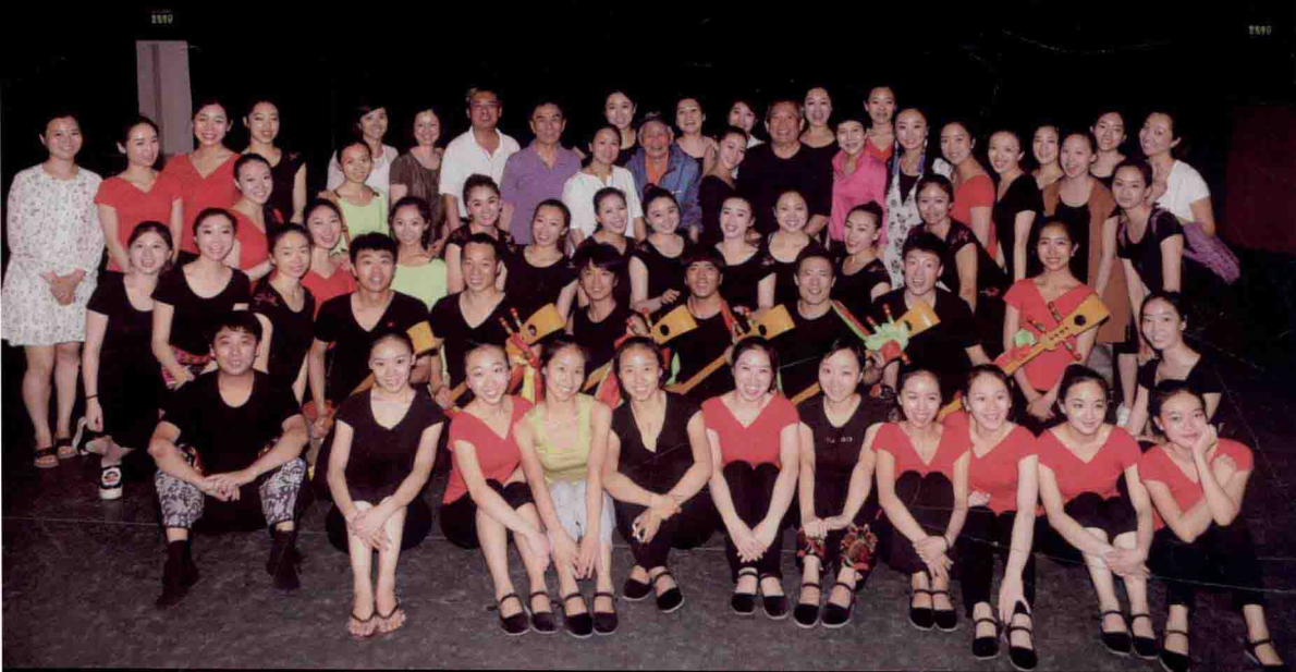
《中国民族民间舞特色教程》进入北京舞蹈学院研究生课堂并举行课题汇报展示