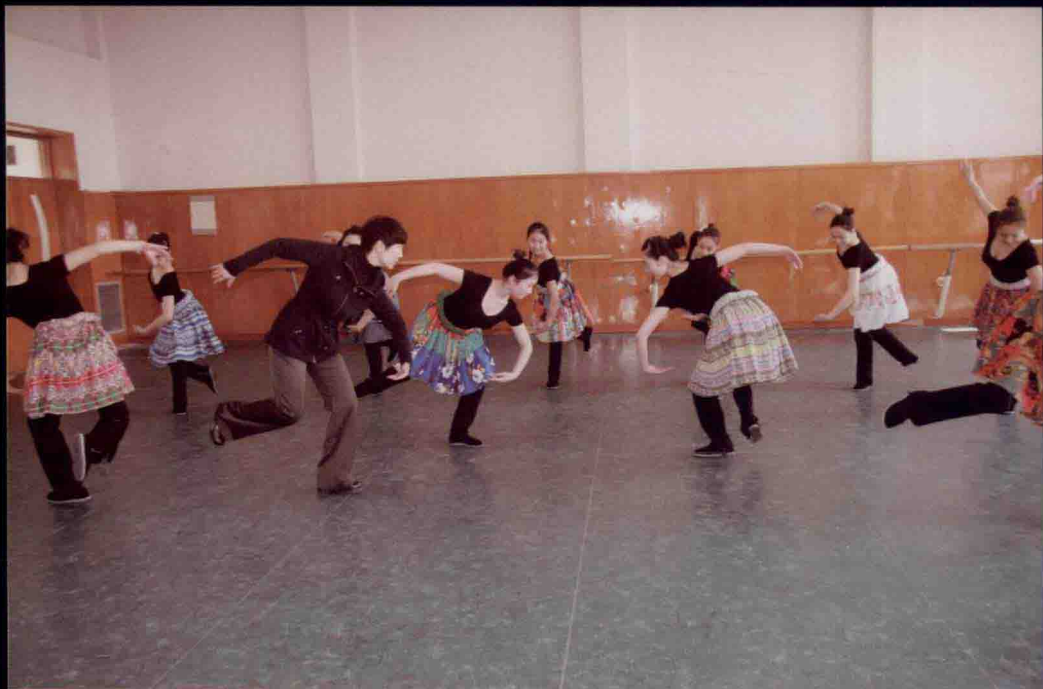
《中国民族民间舞特色教程》之彝族《马鞍山打歌组合》进入北京舞蹈学院继续教育学院本科课堂