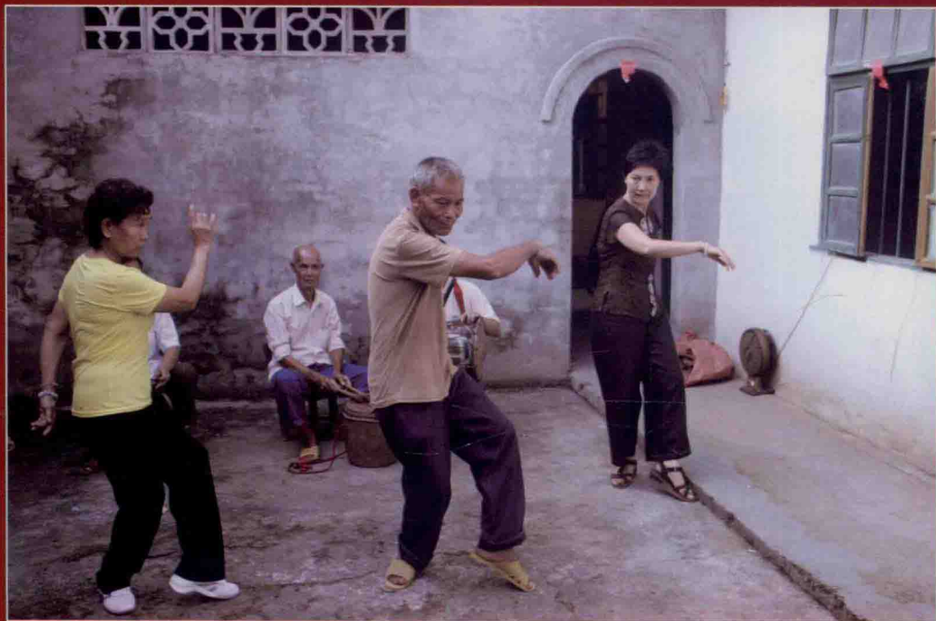
2010年广西武鸣县壮族师公舞采风