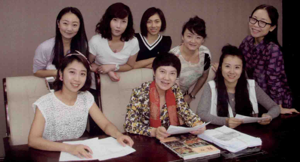
《中国民族民间舞特色教程》教学研究