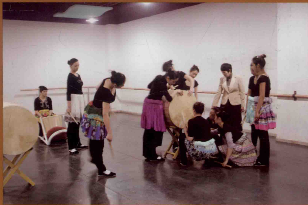
苗族舞蹈教学研究