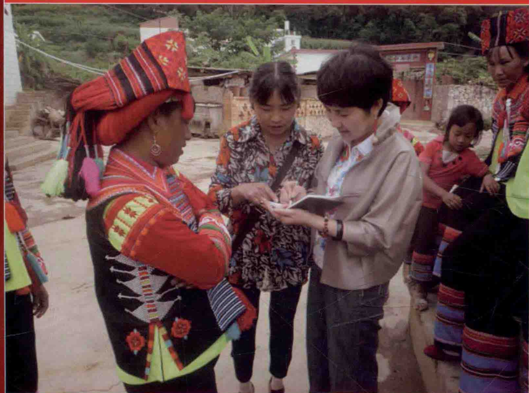
2011年云南红河州斗岩村彝族打跳采风