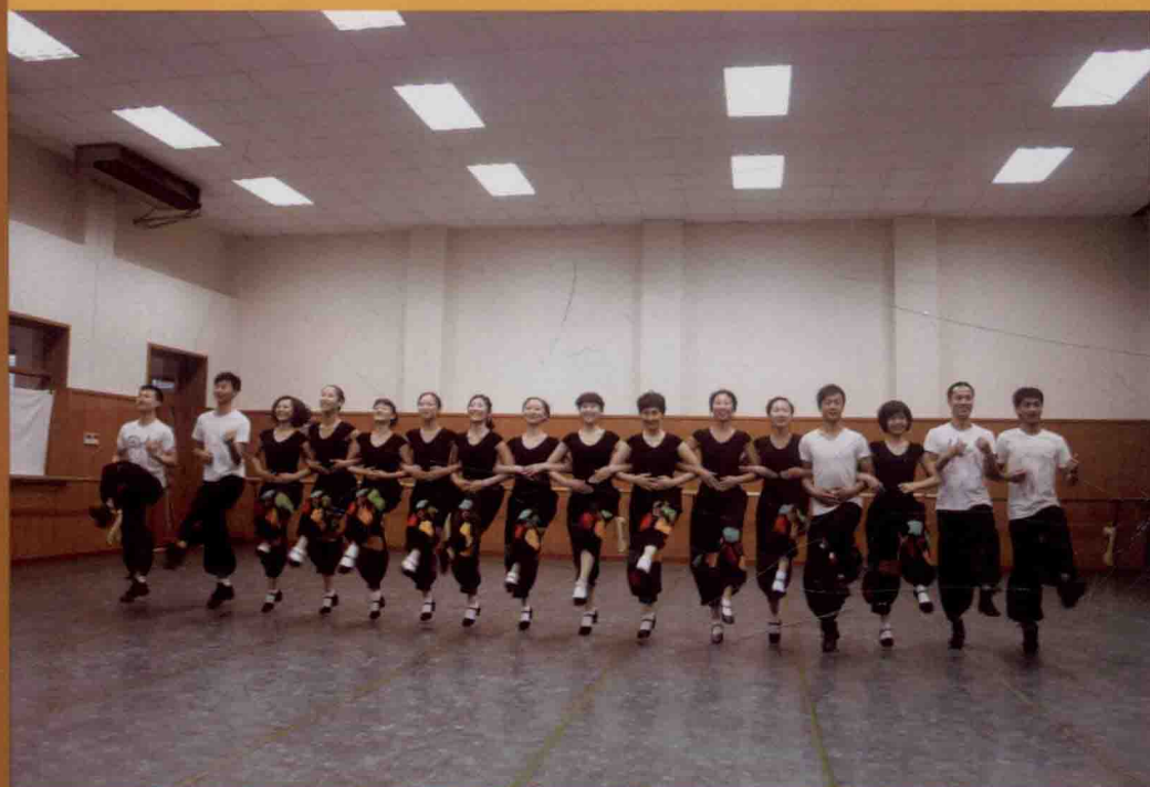
彝族左脚舞教师进修