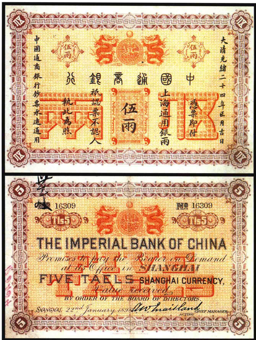
图版四 光绪二十四年中国通商银行钞票（五两） （原图 16.5 × 11 厘米）