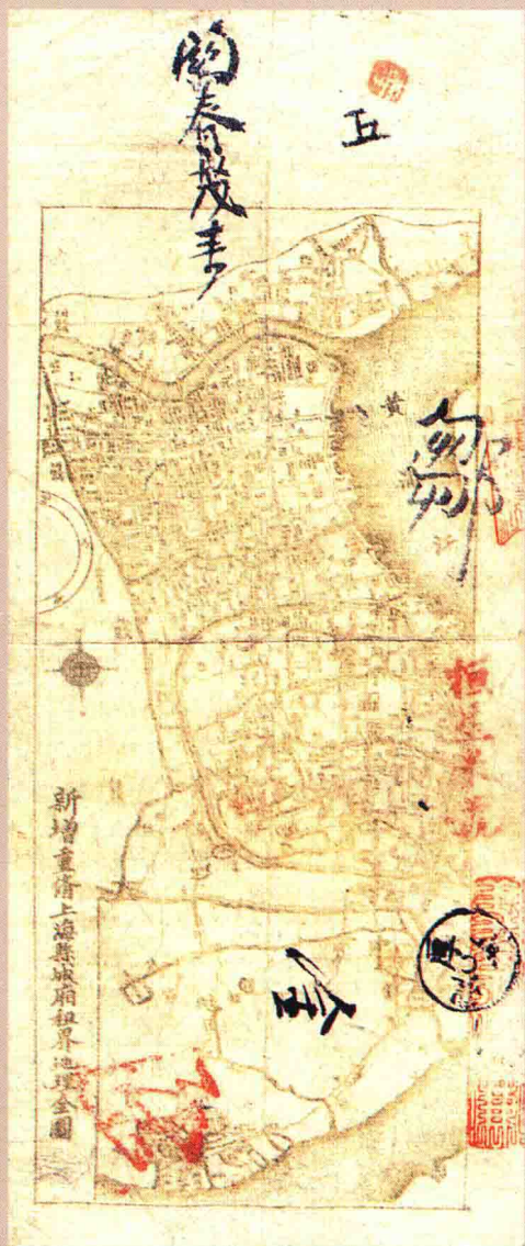
图版五 光緒二十五年春恒茂典钱票 (原图 10 × 24.8 厘米)