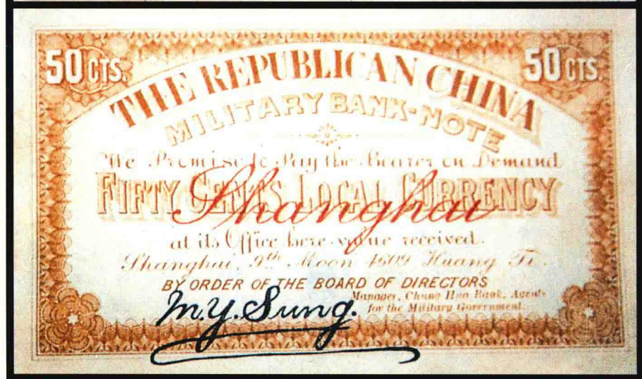
图版十三 黄帝纪元中华民国军用钞票（五角） （原图 12 × 7.5 厘米）