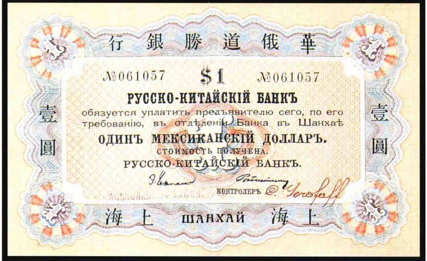
图版七 1901 年华俄道胜银行银元券 (一元) (原图 16 × 10 厘米)