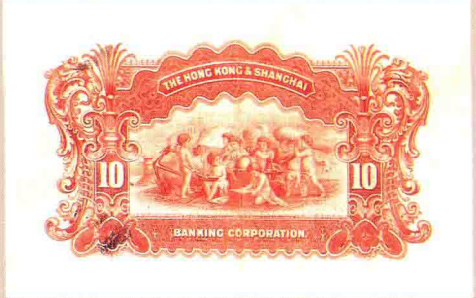
图版六 1900年英商香港上海汇丰银行银元券