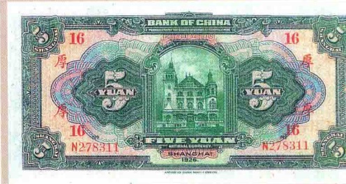
图版十四 中国银行兑换券