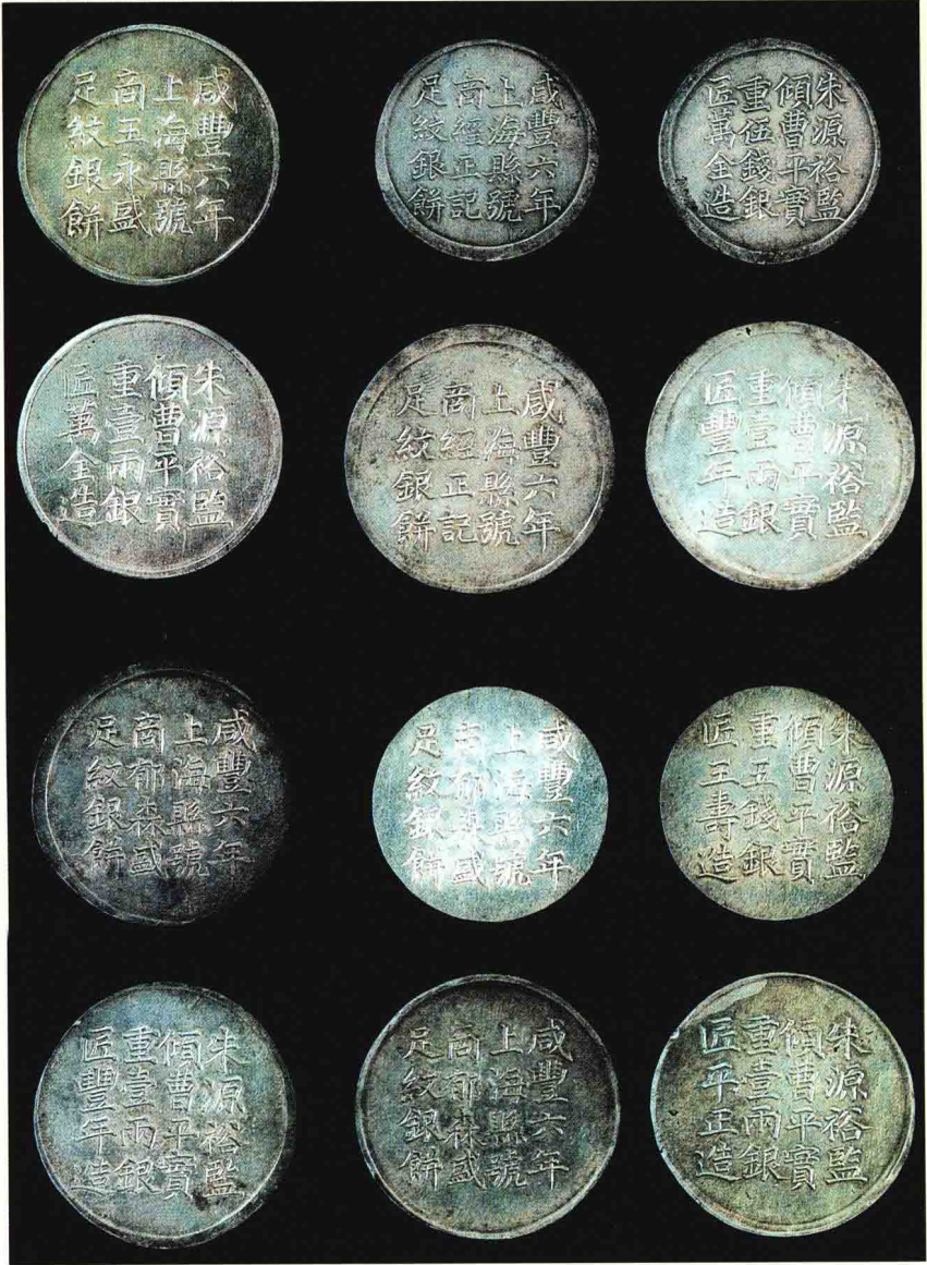
图版二 咸豐六年上海縣號商銀餅