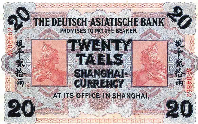
图版九 1907年德华银行银票（二十两）