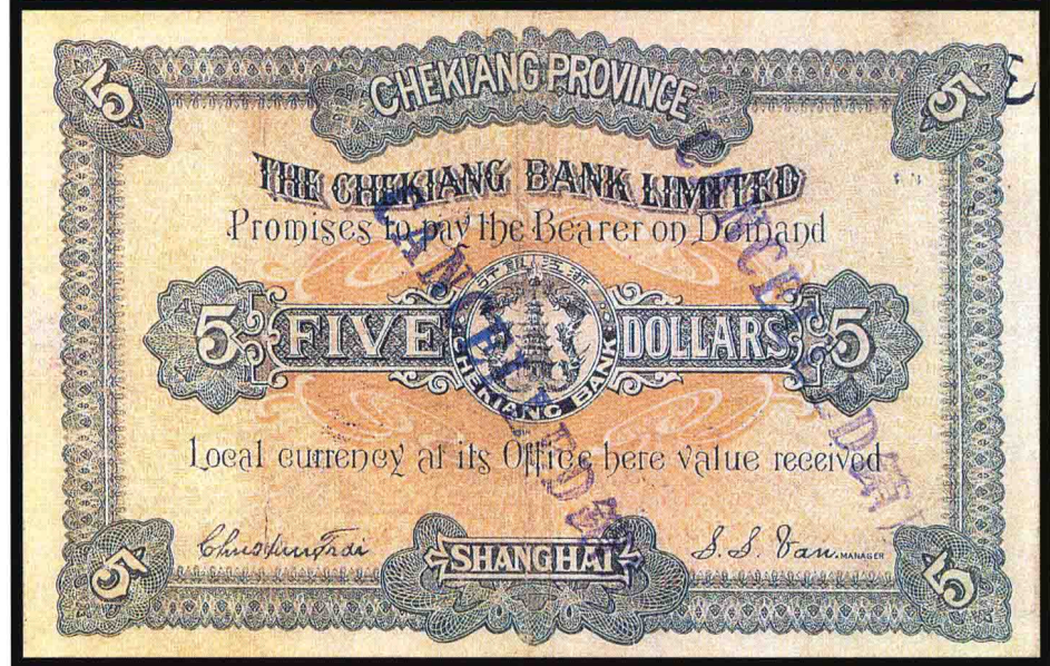
图版十二 清末浙江银行银元券（五元） (原图16.4 × 10.5厘米)