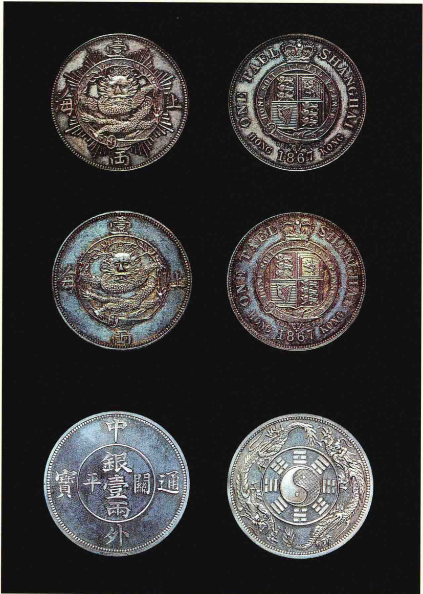
图版三 上海一两和中外通宝银币