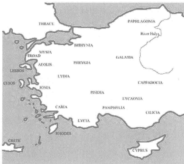
著名的“希腊”爱奥尼亚地区位置不在希腊半岛，而在东方亚洲的土耳其半岛。

实际上，20世纪以来，挑战文艺复兴以后共济会史学构筑的希腊崇拜的新异观点不断出现，只是由于中国学术界的孤陋寡闻而对此很少知道而已。