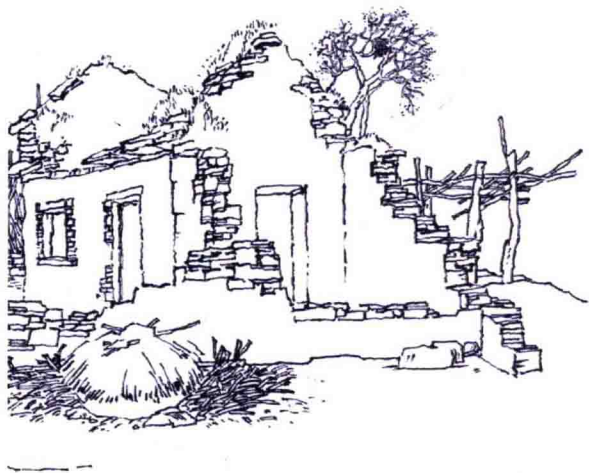
图 1-1-1 农村剩余劳动人口进入城市后，“空心村”现象在农村越来越普遍，在一定程度上体现了乡村的失落。

由于生活空间封闭、交通闭塞、通讯落后、信息传播速度缓慢等因素，导致了我国部分地区的农民在思想和行为上的封闭性及狭隘性，对新思想、新观念存在一定程度的抵抗情绪。虽然近年来农民的受教育程度与以前相比有了很大的提高，但是文化水平偏低的现象仍然存在。农民的思想认识水平还处在较低的状态，主要表现在传统小农意识明显、封建迷信思想严重等方面，由此又导致了农民在思想和文化行为方面与现代文明不相符合的现象。面对新农村建设繁重而艰巨的任务，相当数量的农民表现的不适应，教育和观念的落后，成为新农村建设的最大障碍。