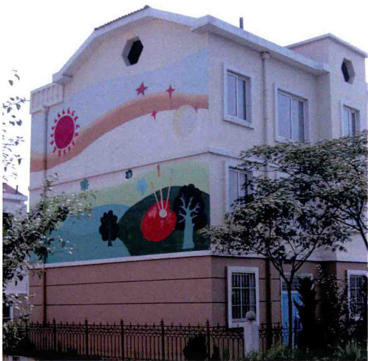
图 2-1-1 新建楼房的墙面壁画

说法是为了解构现代主义的所谓纯艺术的思想，但的确在很大程度上，降低了艺术的飞行高度”。由此看来，美术是全社会的事业，它不仅仅属于艺术家，而且是每个人的美术。当今美术包括了雕塑、绘画、设计、建筑和环境规划等专业，从人的整容化妆，到首饰衣装、居室房舍、街道城市、自然环境等，所有美化任务都被承担了，美术已经成为当代最发达的行业。美术的美化功能以装饰和造型为媒介，至今已产生了设计作为其归宿。