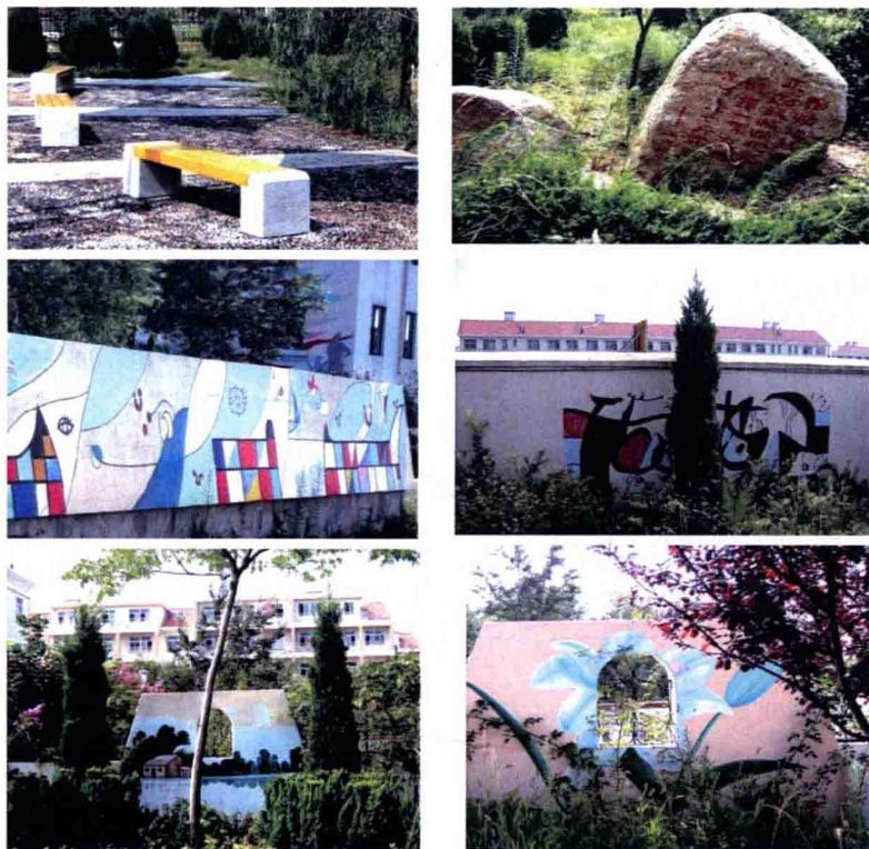
图 1-2-1 青岛大泥沟头村的壁画