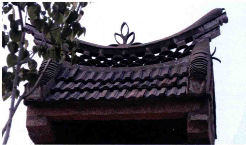
图 1-2-2 山东荣城市礼村门楼装饰

几千年来，中国都是一个以农业为基础的国家，民族传统文化不断传承与发展的动力源也根植于农村。在这种动力的驱使下，农村文化的内在因素从民族传统文化的“根”上生发出来，以各种文化形态体现出了民族传统文化历经千年的精髓，并保存至今（如图 1-2-2）。