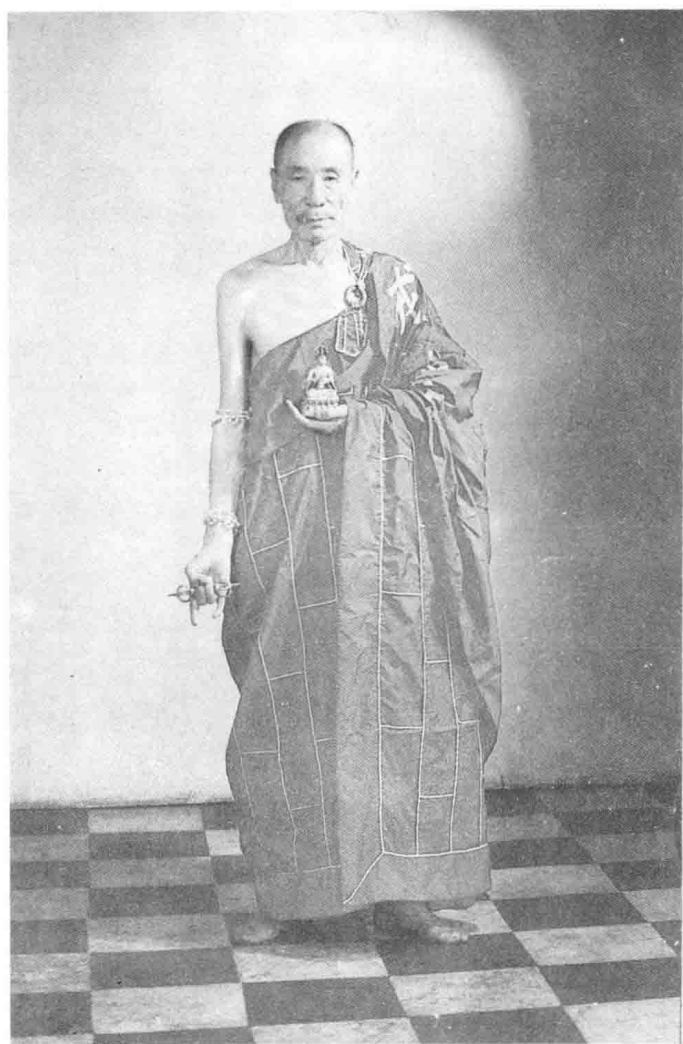
山西省佛教协会高僧妙体法师