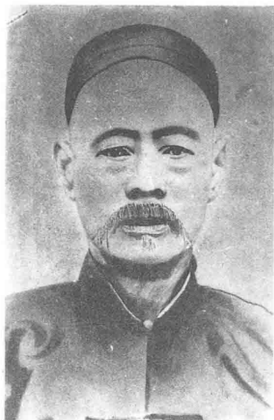
山西六合心意拳一代宗师车永宏先生