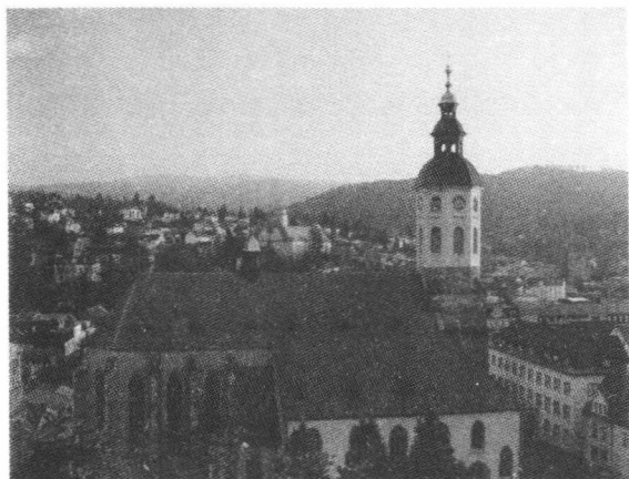
图2 今德国著名温泉疗养地——巴登巴登