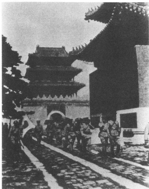
图1 满洲事变。关东军攻占奉天城（今沈阳）