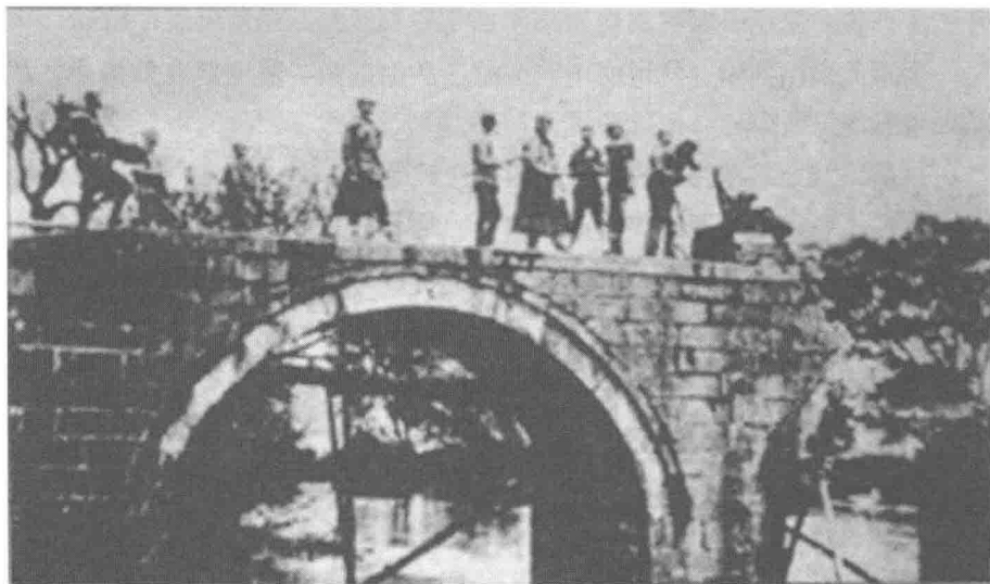
中方指挥官在前线观察敌情

他说：“上高后侧与长沙相通，公路也未被破坏，对方是完全可以沿着公路直扑长沙的。”