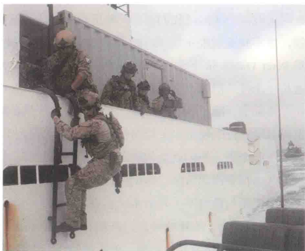
▲ 2011年7月28日，加利福尼亚州长滩，美国海军海豹队员在第12特殊舟艇小队（SBT-12）的支持下进行攀爬油气平台技巧练习

“我们驾驶的是一艘24英尺长的RHIB，拼尽全力才爬上了浪尖，发动机的声音听起来似乎马上就要报废了，紧接着又从浪尖直冲下来，那感觉像是我们正在玩24英尺长的冲浪