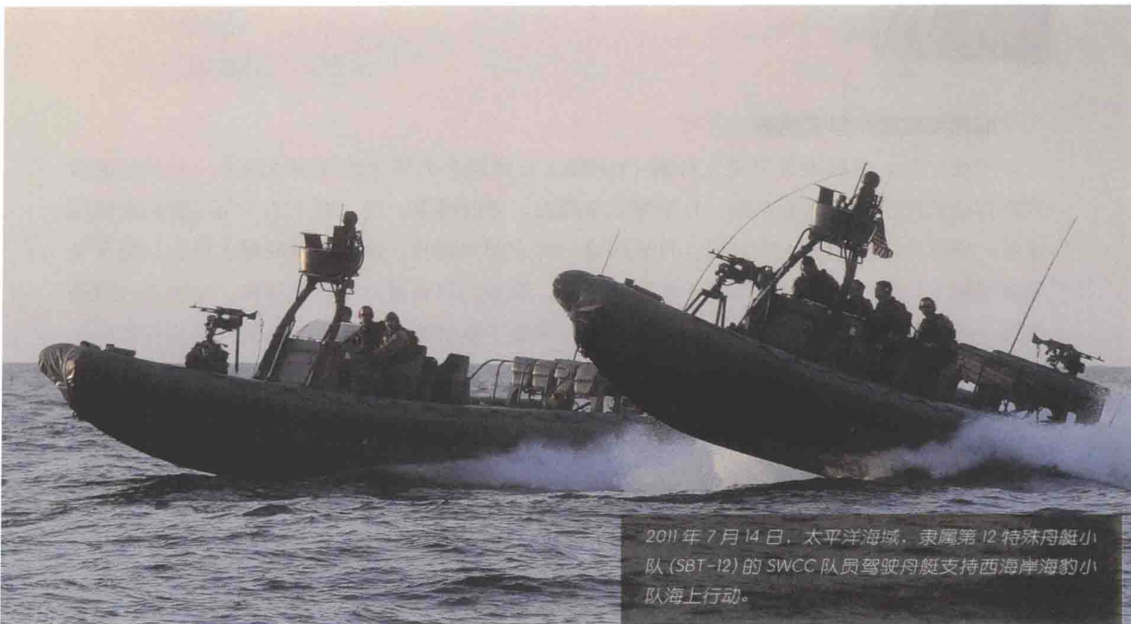
2011年7月14日，太平洋海域，隶属第12特殊舟艇小队(SBT-12)的SWCC队员驾驶舟艇支持西海岸海豹小队海上行动。