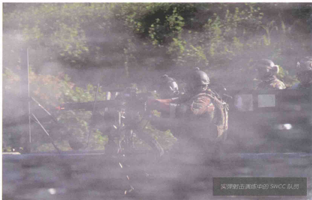
实弹射击演练中的 SWCC 队员