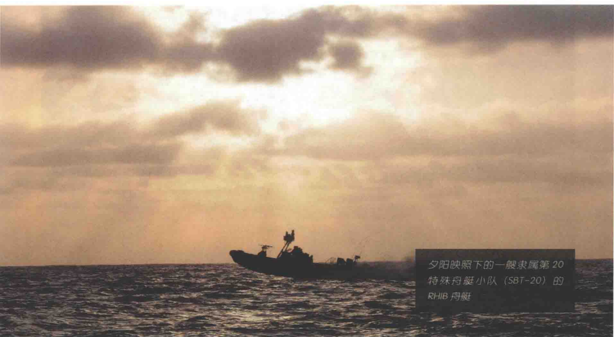
夕阳映照下的一艘隶属第 20 特殊舟艇小队 (SBT-20) 的 RHIB 舟艇