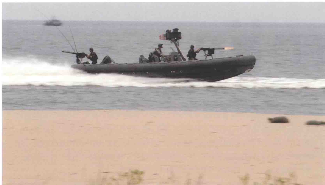
▲ 2010年7月17日，弗吉尼亚州弗吉尼亚比奇，第41届水下爆破队/海豹（UDT/SEAL）东海岸重聚活动上，隶属第20特殊舟艇小队（SBT-20）的SWCC队员正在进行能力展示。该活动用于纪念水下爆破队和海豹的历史以及传承