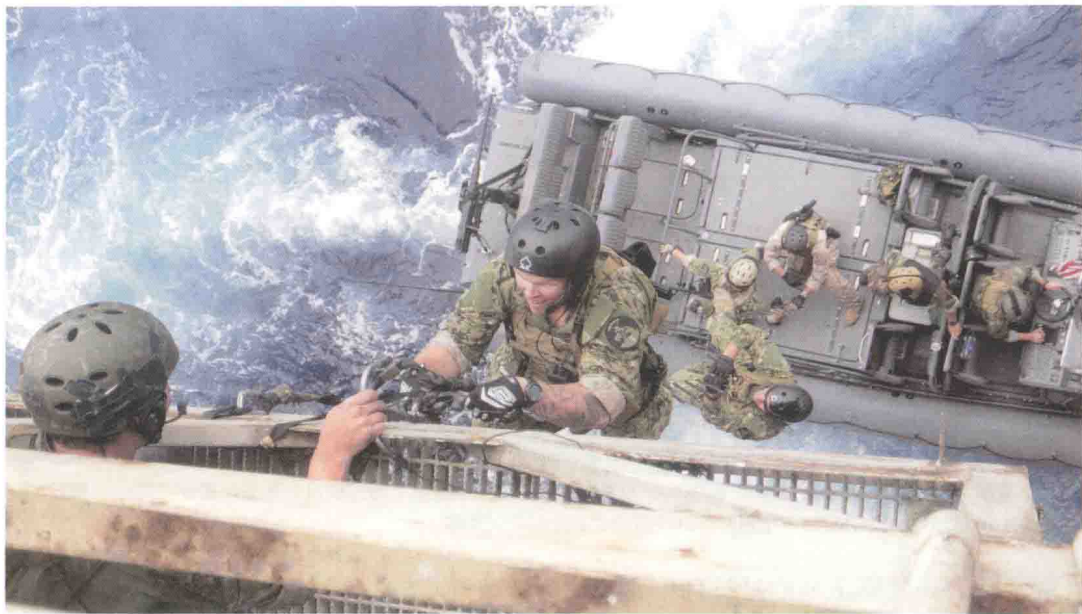
▲ 2012年3月23日，圣地亚哥，一名执行VBSS任务的西海岸海豹小队海豹队员正沿舷梯而下，登上一艘隶属第12特殊舟艇小队（SBT-12）的舟艇

员们要不断承受几乎让人骨头散架的海浪冲击，其强度一般在10~15个，峰值达到20g。为了缓和如此高强度的冲击力，SWCC所驾驶舟艇上的座椅上都安装了花费数百万美元研制出来的高性能减震装置。