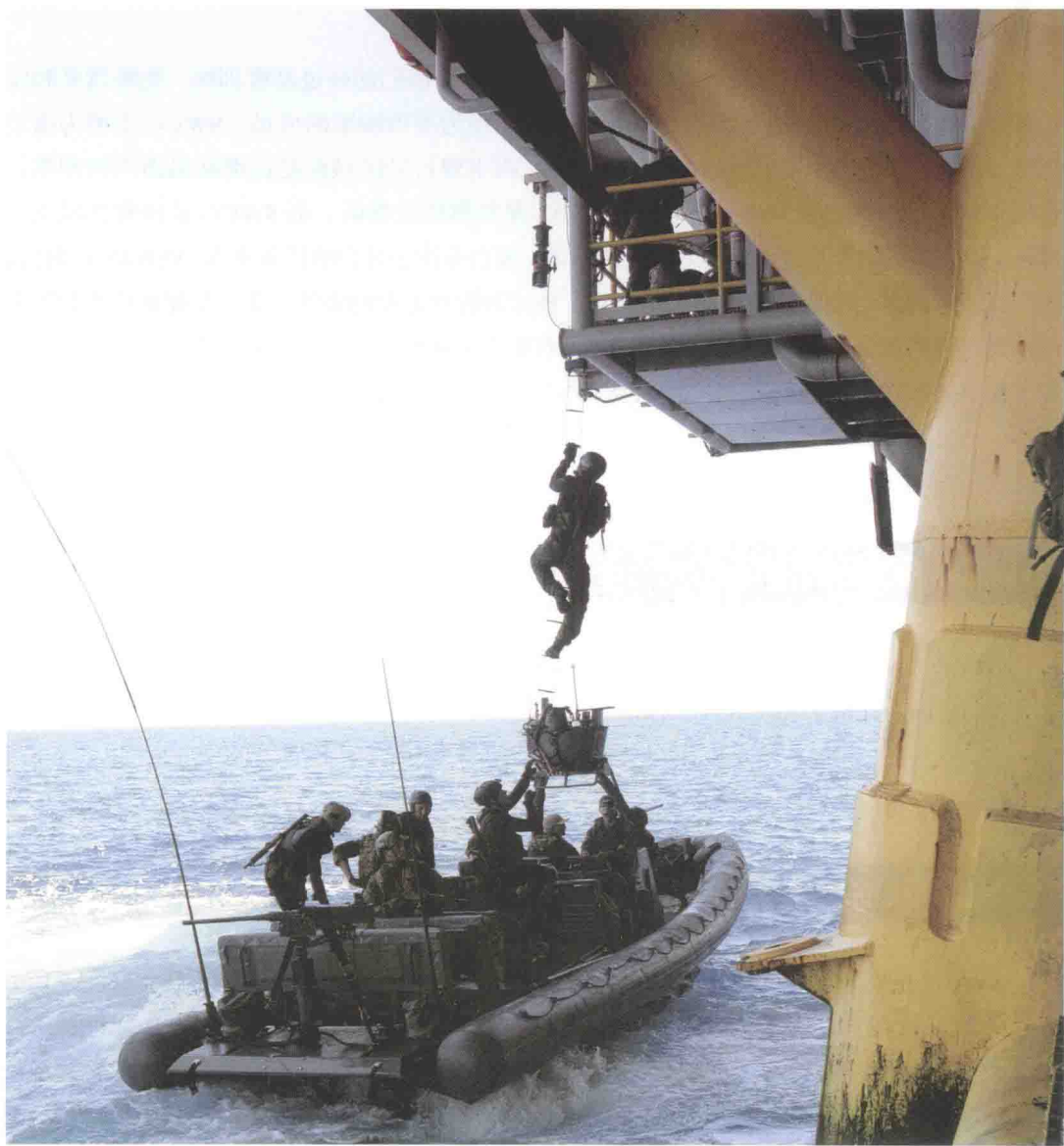
▲ 海豹队员练习从一艘移动中的 RHIB 上沿绳梯爬上油气平台

板。在像小山一样的巨浪中，我们几乎无法看见其他舟艇的位置。在与如此艰难的海况奋力战斗了 10 小时之后，你唯一想做的事情就是赶快离开舟艇上岸。但办不到。膝盖像灌了铅一样沉，手仿佛冻在了舵柄上，后背如同饱尝了一顿迈克尔·泰森的重拳。第二天晚上，同样的事情又要再来一遍。直到你已经麻木，不记得这到底是第几次了。”