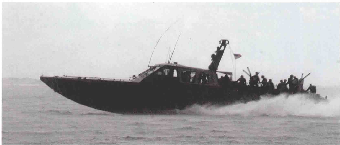
▲ 2008年7月19日，弗吉尼亚州诺福克，作为为期4天的水下爆破队/海豹联合会东海岸重聚活动的一部分，一艘由SWCC队员驾驶的MK 5型特种作战舟艇迎着暴雨在海面疾驰

(SEAL)，但实际上他们是特种作战战斗舟艇艇员(SWCC)，绰号“舟仔”(Boat Guys)。大部分人都分不清两者之间的区别，但的确有人懂得。美国的《男士健身》(Men's Fitness)杂志曾经做过一个关于军队体能训练的专题，为此专门去美国海军寻找合适的成员作为封面人物。按照设想，他们需要找一些在海军中知名度不是很高，但是一旦现身却能掀起巨大波澜的人。“我们需要一些厉害的家伙。他们必须是真正的战士，身体强健、攻击性强，毫不犹豫就能举起450磅 ① 的重量。”最终被选作封面人物的是SWCC水面声纳技术员Peter Hamilton下士。尽管这些杂志编辑对于SWCC还不能完全了解，但是他们清楚：这是一个特殊群体，毫不畏惧、积极进取。