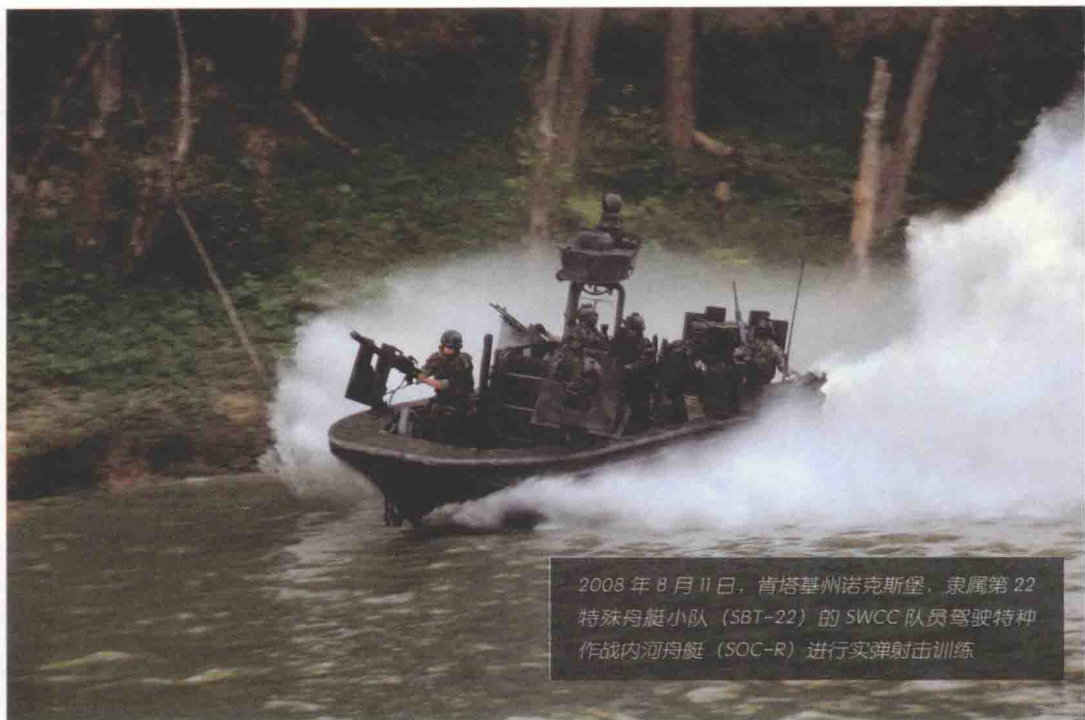
2008年8月11日，肯塔基州诺克斯堡，隶属第22特殊舟艇小队（SBT-22）的SWCC队员驾驶特种作战内河舟艇（SOC-R）进行实弹射击训练