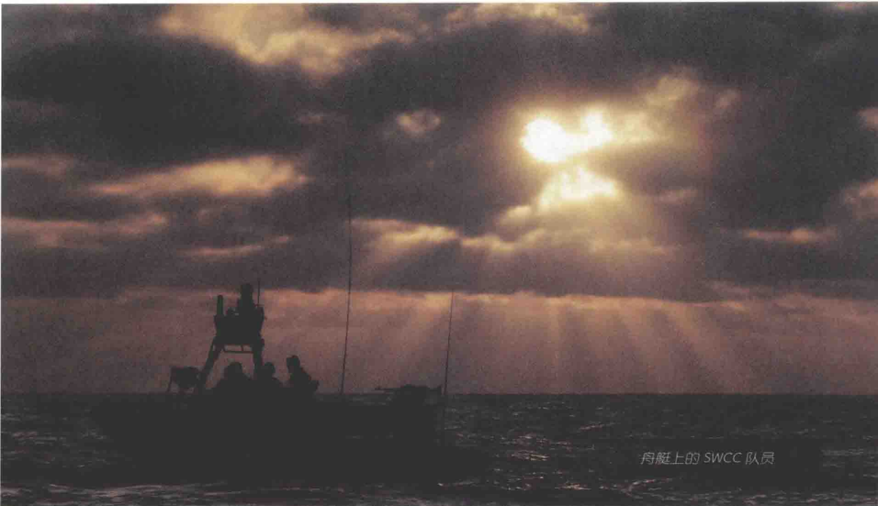
舟艇上的 SWCC 队员