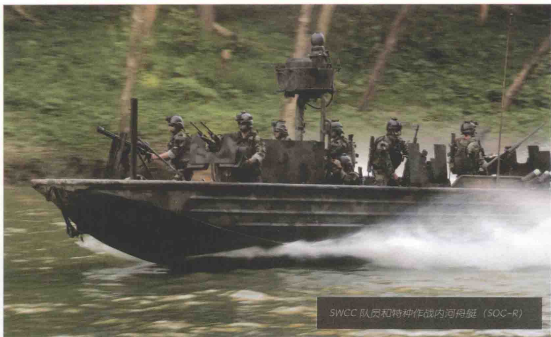
SWCC队员和特种作战内河舟艇（SOC-R）