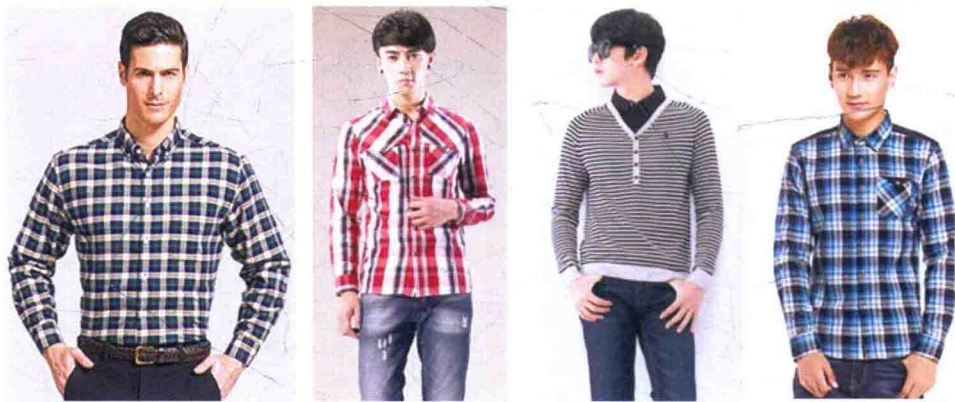
图 1-6 强调质感

如图 1-6 所示，男装面料有精细、厚薄、轻重之别。不同的面料有不同的表现手法和视觉效果。最常用的男装面料的显著特征表现为粗犷、挺括、有质感。男装强调其独有的新锐设计理念和修身剪裁的特殊工艺，保持着特有面料质感和兼具修身剪裁的精致。面料的挺括感对于男装硬朗形象的塑造有着决定性的作用。面料优良的质地更能体现出穿着者的身份和地位。