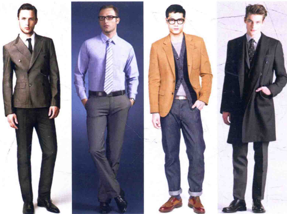
图 1-2 简洁、严谨男装款式

无论是中式男装还是西式男装，穿戴方式非常严谨。特别是在正式场合下，要求更为苛刻，男装在款式造型上有着更加统一的规格和要求。在日常着装中，男装款式严谨、简洁为实用型基本款（图 1-2）。个性化的款式多见于青少年服装中（图 1-3）。男装的外部轮廓多为箱型结构，内部结构也尽量是直线或直线与曲线结合，在设计上力求表现简练的特征。