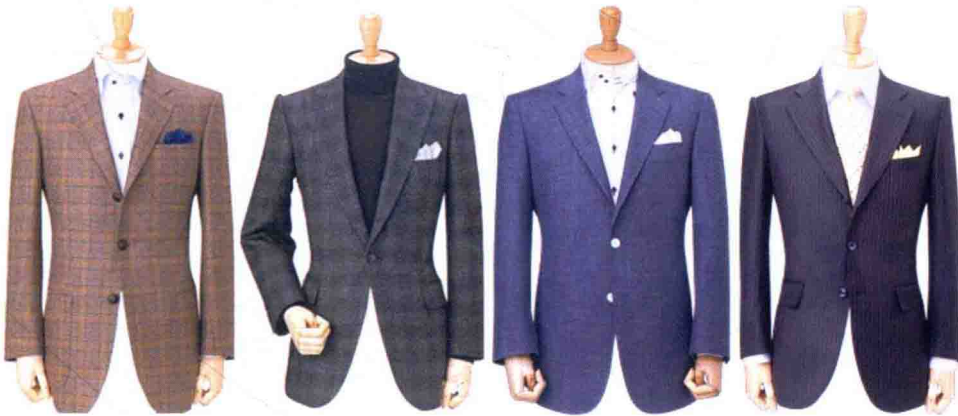
图 1-4 工艺精致

如图 1-4 所示, 男装每一个细节都非常精致, 其精致的工艺, 无论是领口的设计, 还是衣身, 就连衣服上的走线都清晰可见, 完美的收边, 优质纯棉的面料, 舒适柔软, 彰显品质。男装的工艺讲究含蓄与精致, 常用的工艺装饰手法有包边、滚边、褶裥、辑明线、镶嵌、异色面料组合拼接等, 另外还会采用不同肌理和组织的面料做衣领或其他局部结构, 使服装显得大气实用, 美观协调且富于变化。