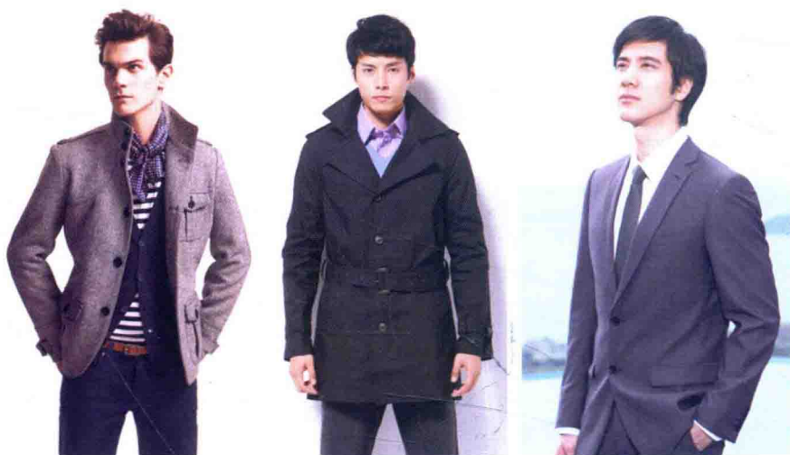
图 1-1 注重功能