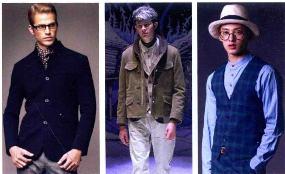
图 1-8 古典风格