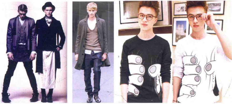
图 1-3 个性化前卫男装