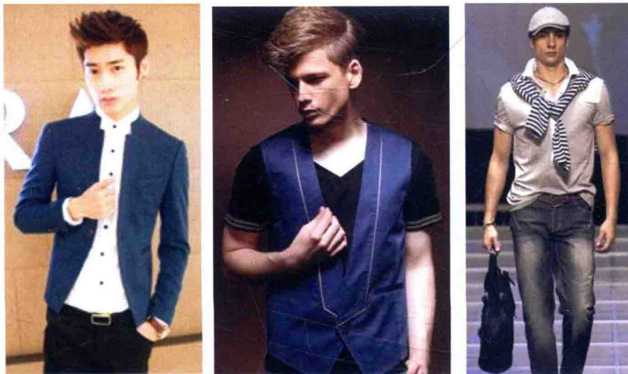
图 1-9 前卫风格

前卫风格是时尚潮流中最具创意的风格，相对于大多数的着装而言，它是时髦、新奇的，甚至是怪异、另类、大胆的，在设计上通过与众不同的构思来表现出作品的独特性和设计师的个性。从社会意义上而言，前卫风格带有强烈的对现实不满色彩，并具有攻击性。前卫风格包含了多种艺术类型和风格（如达达主义、表现主义、波普艺术、欧普艺术等），并结合了各类街头时尚（摇滚、朋克、嬉皮、军服、Hip-Hop 等），在设计中不乏幽默、讥讽、开放、自由的手法；没有拘束，没有和谐，没有原理，没有传统，取消了妨碍设计的一切障碍，一切冲突都被包容，视为合理。对于历史的风格采取抽出、混合、拼接的方法，进行折中处理。解构、混搭思潮也影响前卫风格的演化。前卫风格男装具体表现为款式造型夸张，结构复杂，用色（常用对比色）和搭配（内外、上下）突破常规（图 1-9）。