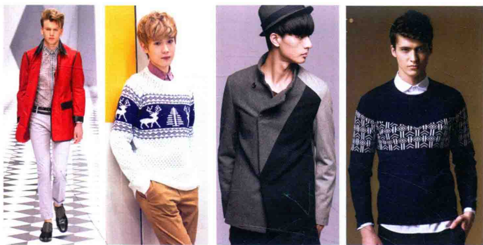
图 1-5 色彩素雅