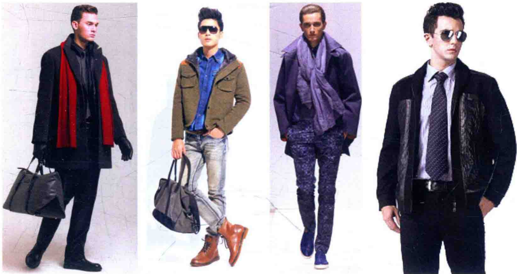
图 1-7 配饰协调