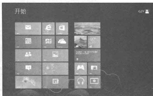
图 1-2 Windows 8 的桌面系统“开始”屏幕