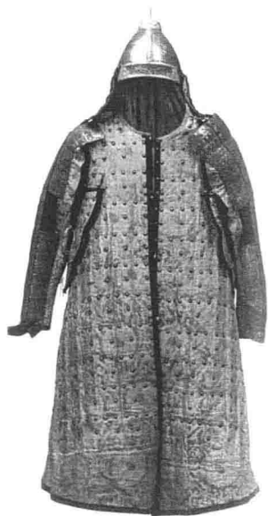
清太祖努尔哈赤盔甲