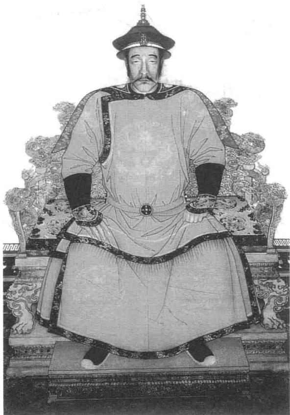
清太祖努尔哈赤朝服像