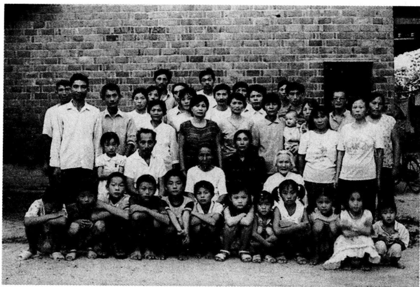
芦荻山乡伍家坪村民（2001年）