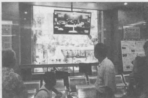
▲ 直播当天，立案大厅内外可通过电视观看直播。

观，也肯定会有很多评论。法官可以从中吸收好的东西，有助于其作出更准确、更符合法律的裁判。对法院来说，庭审网络直播可以改进工作，提高审判质量。当然，法官不能被舆论所左右。