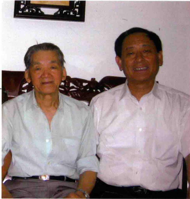
与国医大师路志正合影