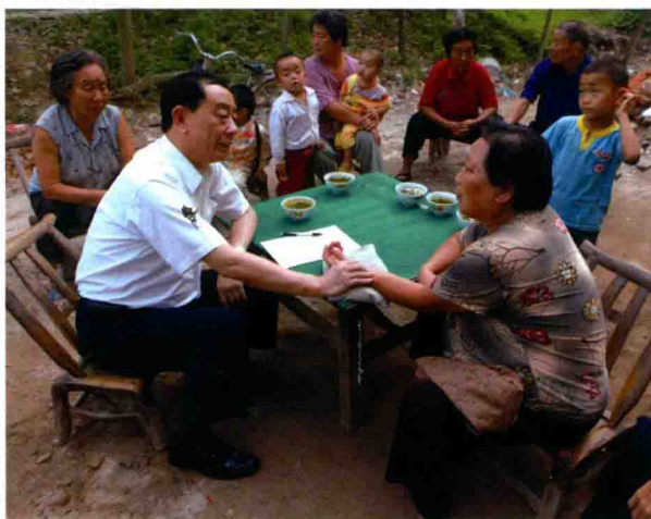
2009 年在农村为患者诊病