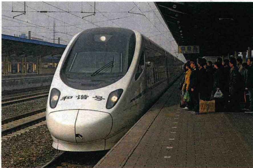
◇现代交通——和谐号列车