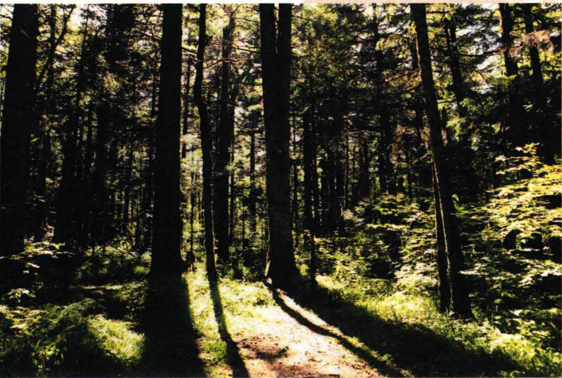
◇东北天然林区风光

中国幅员辽阔，农业发展历史悠久，农业资源丰富，生产类型多样。地域性差异是中国农业生产的一大特征。中国东部地区农业发达，农业生产水平较高，是中国重要的农业区。北部、西北部和西南部广大高原山地区，天然草场资源丰富，是中国重要的畜牧业生产基地。东北地区山地一带，是中国最大的天然林区和木材重要生产基地。