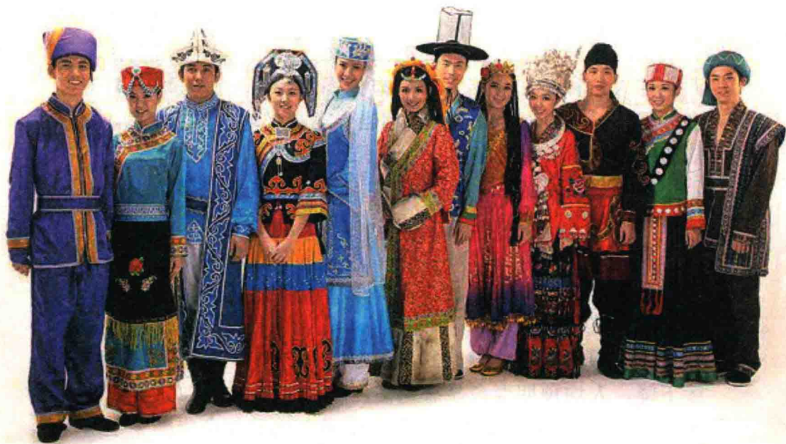
◇ 中国的部分少数民族

在中国总人口中，汉族人口约占总人口的 91.51%，汉族也是世界上人口最多的民族。中国各少数民族人口约占总人