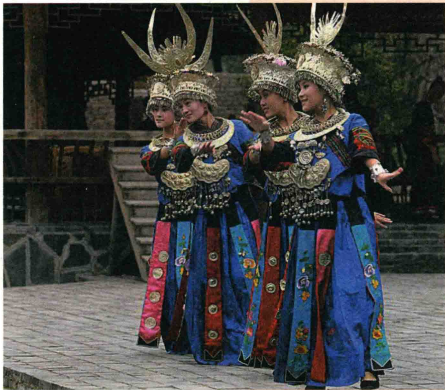
◇贵州西江千户苗族舞蹈

各少数民族聚居的地方实行区域自治，设立自治机关，行使自治权，是中国政府解决国内民族问题的基本政策和重要政治制度。中华人民共和国建立以来，民族区域自治政策