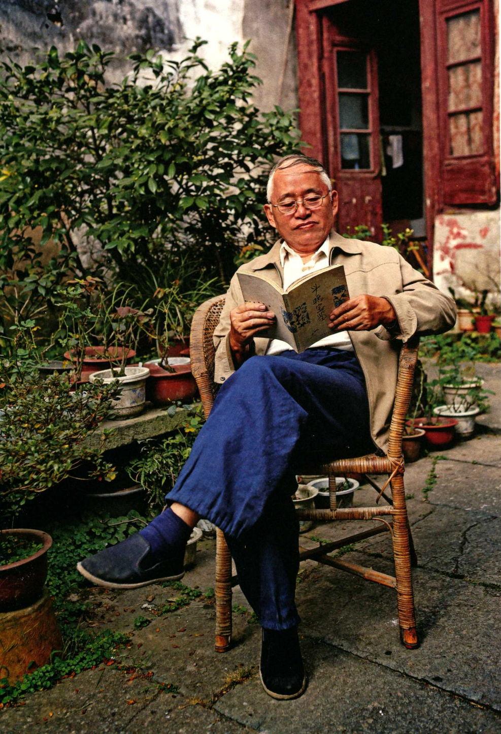
作者吴茂林摄于塘栖古镇宅院